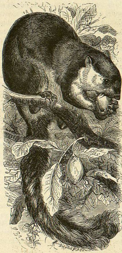
Fig. 29.—LA ARDILLA DE JAVA

CARACTÉRES. —La ardilla de Java (fig. 29) se distingue entre las demás por sus graciosas y esbeltas formas: mide