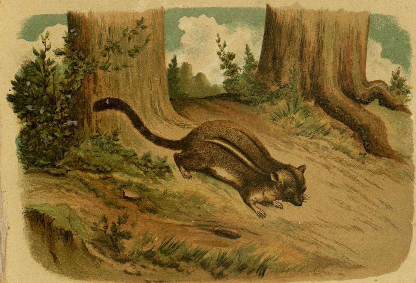
EL TAMIAS ESTRIADO