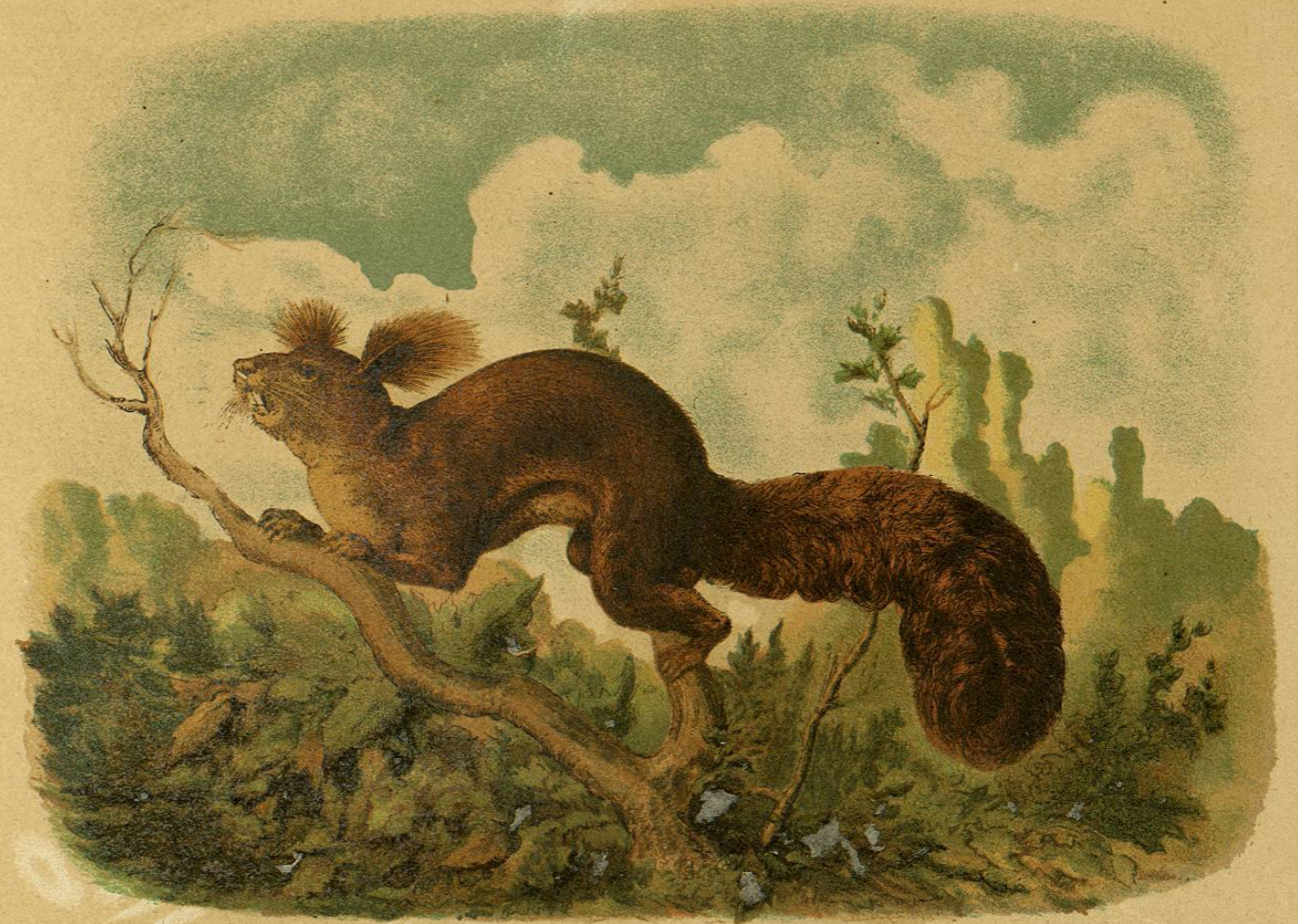
LA ARDILLA REY.

CARACTÉRES. —El taguan (fig. 31) es una de las ardillas voladoras mas conocidas y la de mayor tamaño de toda la familia; tiene, poco mas ó menos, la talla del gato doméstico; su cuerpo mide 0 m ,60 de largo; la cola 0 m ,55, y su altura hasta el lomo 0 m ,20. El cuerpo es prolongado, el cuello corto, la cabeza pequeña y el hocico obtuso; las orejas son cortas, anchas, levantadas y puntiagudas; los ojos grandes y salientes; las piernas posteriores notablemente mas largas que las delanteras, y los dedos de las patas anteriores armados de uñas cortas, encorvadas y puntiagudas, excepto el pulgar que es rudimentario. La cola, larga y colgante, está cubierta de pelos abundantes y espesos; los del cuerpo y de los miembros son cortos, compactos, aplanados y bastos, principal-