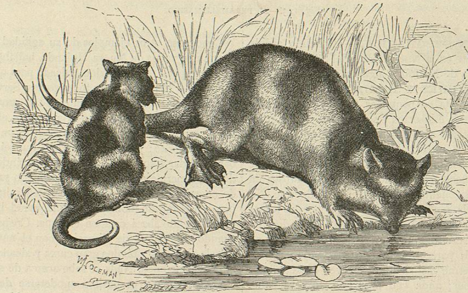
Fig. 122.—EL QUIRONECTO VARIADO

USOS Y PRODUCTOS. —Cuando invaden en gran número las plantaciones, algunos de estos animales son dañinos; de otros aprovecha el hombre la carne y la piel; de modo