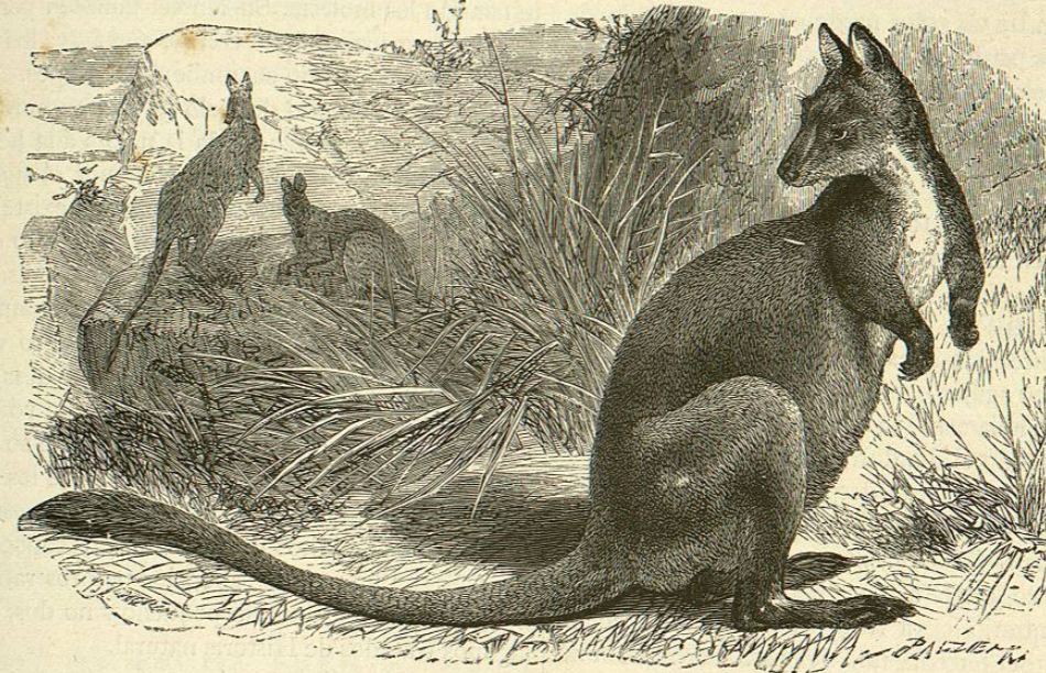
Fig. 140.—EL PETROGALO DE PINCEL

»Es muy curioso ver á estos animales recoger la yerba necesaria para hacer su nido. Para ello se sirven de su cola, que es prehensil; cogen con ella una mata y la llevan al punto elegido. Cuando están cautivos tienen la costumbre de trasladar á su agujero diversos materiales, ó por lo menos, así lo