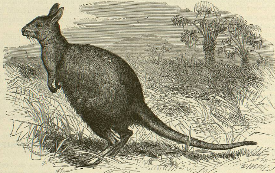
Fig. 139.—EL LAGORQUESTO LEPOROIDRO

negras y blancas; el vientre es de un blanco sucio ó amarillo. El último tercio de la cola está cubierto de pelos largos y negros, que orman una borla. El cuerpo mide 0 m ,66 de largo total, siendo de 0 m ,30 la cola (fig. 142).