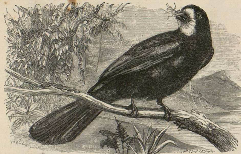
Fig. 34.—EL TRAPISTA PARDO

CARACTERES. —Se diferencian de los nistalos por su