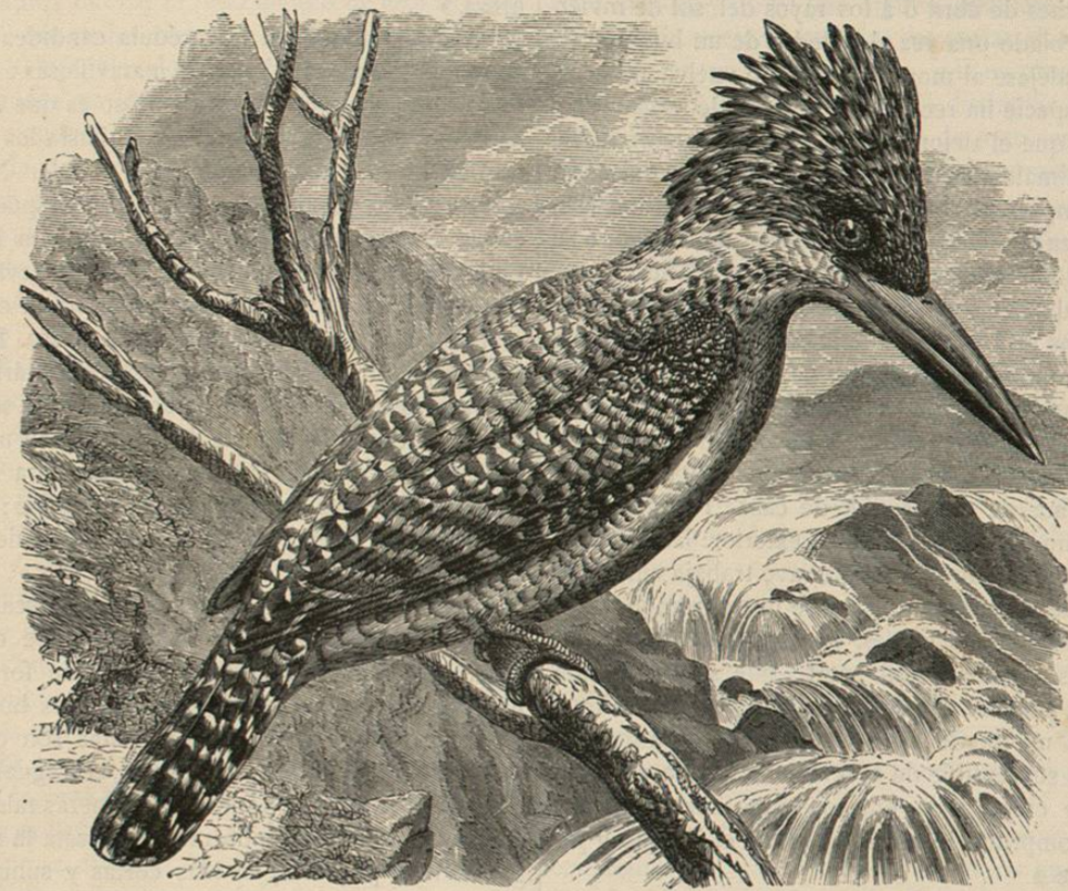
Fig. 63.—EL CERILO MOTEADO

USOS, COSTUMBRES Y RÉGIMEN. —Todas las especies de este grupo se establecen en las inmediaciones de las corrientes mientras haya peces en ellas, tanto en las regiones mas elevadas como junto al mar. Viven solitarios ó