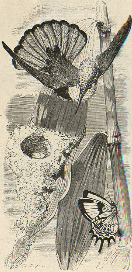
Fig. 103.—EL CRISOLAMPO NINFA

CARACTÉRES. —Representa una de las especies mas bonitas del grupo: todo su cuerpo es de color negro aterciopelado, excepto la rabadilla y las patas; las cobijas de las alas de un verde bronceado, y las rémiges negruzcas con visos violeta; las dos rectrices medias negras, con visos azul violeta; las cuatro externas blancas, orilladas de negro en su extremidad. Esta ave mide 0",12 de largo, el ala plegada 0",07 y la cola 0",04 (fig. 111).