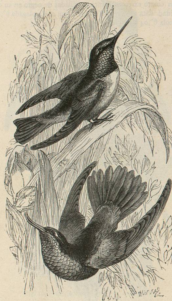
Fig. 101.—EL COLIBRI PROPIAMENTE DICHO

mente besa flores (fig. 109), representa la especie mas conocida del género. El lomo y los lados del cuello son de color verde bronce, con reflejos dorados, al menos en los adultos; las rémiges de un tinte negruzco con visos violeta; el vientre blanco; las tres rectrices externas del mismo color, y las medias de un bonito azul con matices cobrizos. Por debajo del ojo arranca una raya de un negro aterciopelado, que se en-