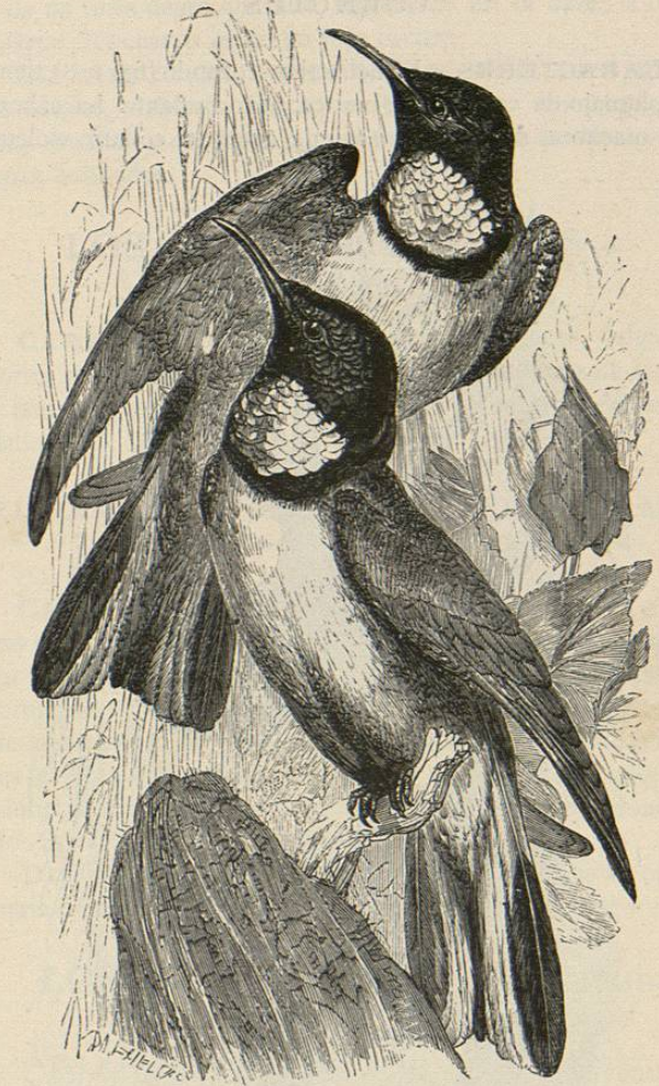
Fig. 104.—EL ORETROQUILO DEL CHIMBORAZO

La hembra no tiene tintes tan vivos; carece de moño y de collarin, y su cara no presenta los brillantes visos de la del macho.