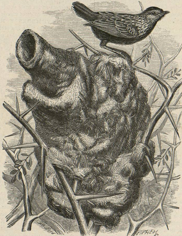
Fig. 225.—EL CISTICOLA TEJEDOR

con matiz violeta. En este caso se parecen mucho á los huevos de la curruca gárrula, pero otros hay que se parecen mas á los del pipí ó á los de la alondra de monte. Macho y hembra se relevan para cubrir, dedicándose con tanto ardor á este trabajo que se les puede observar muy bien, y si se espantan vuelven sin vacilar, ya de un solo vuelo, ya acercándose á saltitos de rama en rama. Cuando los pequeños pueden volar abandonan todos el carrizal y pasan á las espadañas ó á las altas yerbas, donde permanecen hasta setiembre corriendo por el suelo húmedo.