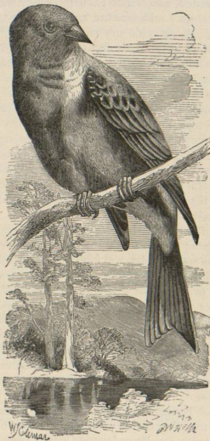
Fig. 240.—EL EMBERIZA HORTELANO

DISTRIBUCION GEOGRÁFICA. —La patria del emberiza amarillo comprende el norte y centro de Europa y