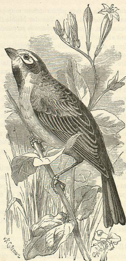
Fig. 242.—EL EMBERIZA AMERICANO

USOS, COSTUMBRES Y RÉGIMEN. —Estos pájaros viven mucho en tierra, como los embercizados: unos habitan en los bosques, evitando los lugares descubiertos; otros buscan los lugares húmedos, y las orillas de las corrientes; y al-