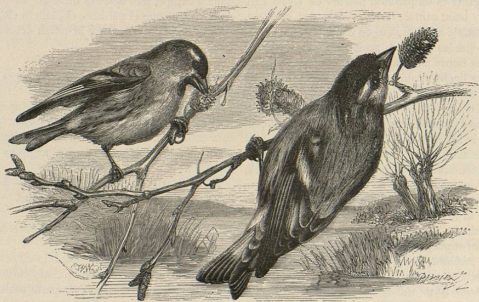
Fig. 250.—EL VERDERON DE LOS ALISOS

USOS, COSTUMBRES Y RÉGIMEN. —El pardillo es uno de nuestros pájaros mas bonitos, y de los mas buscados para las habitaciones por su canto. «El pardillo, dice mi padre, es sociable, alegre, vivaz y bastante tímido: fuera del tiempo de la reproducción vive con sus semejantes en ban-