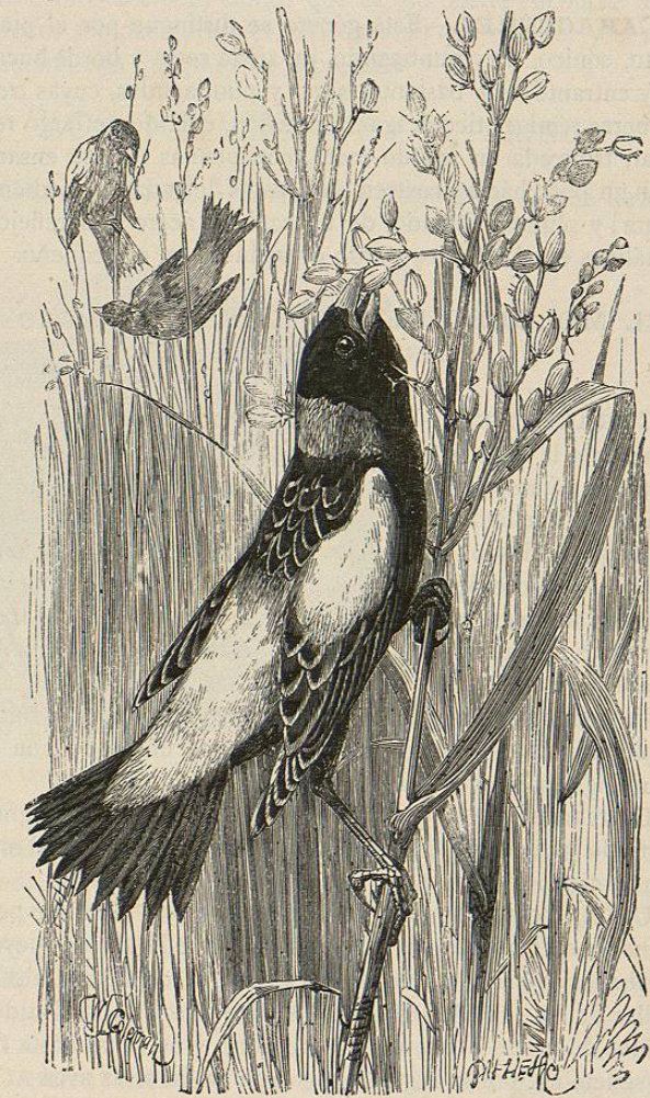
Fig. 8.—EL DOLICONIX ORICÍVORO

yerbas esparcidas y de crines. Cada nido contiene de cuatro á seis huevos de color pardo claro, cubiertos de manchas oscuras diseminadas. «En aquel momento, dice Audubon, puede apreciarse la fidelidad y el valor del macho: vela cuidadosamente por su compañera; si alguien se aproxima, le rechaza con sus gritos amenazadores y de angustia; á menudo se acerca al hombre que voluntaria ó involuntariamente turba su tranquilidad, ó bien se posa en una rama sobre el nido, y lanza gritos tan planíderos, que se necesita ser muy cruel para no dejar tranquilos á los pobres pájaros.»