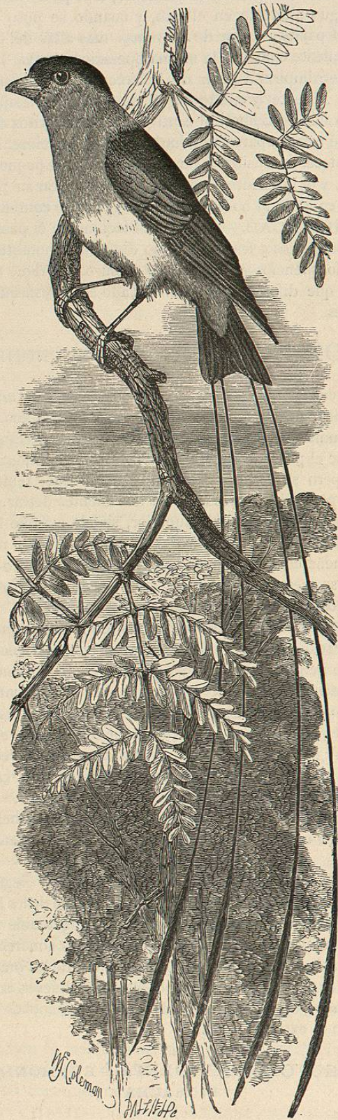
Fig. 6.—EL TETRENURO REAL

rémiges tiran al verde; estas últimas están orilladas de blanco en la base, y de verdoso en el resto de su extensión; las rectrices son de un verde azul de acero por encima y negras por