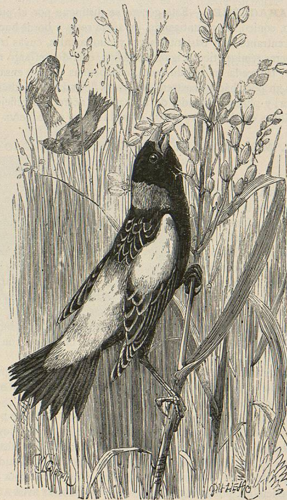
Fig. 8.—EL DOLICONIX ORICÍVORO

yerbas esparcidas y de crines. Cada nido contiene de cuatro á seis huevos de color pardo claro, cubiertos de manchas oscuras diseminadas. «En aquel momento, dice Audubon, puede apreciarse la fidelidad y el valor del macho: vela cuidadosamente por su compañera; si alguien se aproxima, le rechaza con sus gritos amenazadores y de angustia; á menudo se acerca al hombre que voluntaria ó involuntariamente turba su tranquilidad, ó bien se posa en una rama sobre el nido, y lanza gritos tan planíderos, que se necesita ser muy cruel para no dejar tranquilos á los pobres pájaros.»