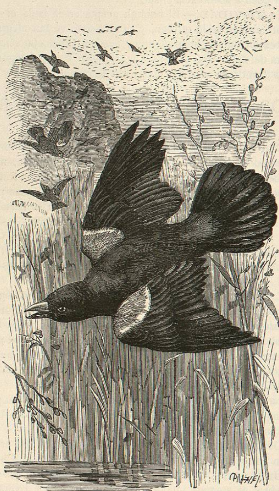
Fig. 9.—EL AGELAYO ENCARNADO

demás pájaros. Cierta dia vi una hembra que se alejaba asi, como si buscara alguna cosa; curioso por averiguar lo que trataba de hacer, monté á caballo y la seguí; de vez en cuando la perdía de vista, mas no tardaba en aparecer de nuevo. Dirigiase hácia todas las arboledas, registrándolas atentamente, sobre todo en los puntos donde acostumbran á formar su nido los pajarillos, y al fin se precipitó en una espesa breña de alisos y de zarzas; estuvo allí cinco ó seis minutos y salió despues para ir á reunirse con sus compañeros. En la breña encontré el nido de un amarillito ( Sylvia marylandica )