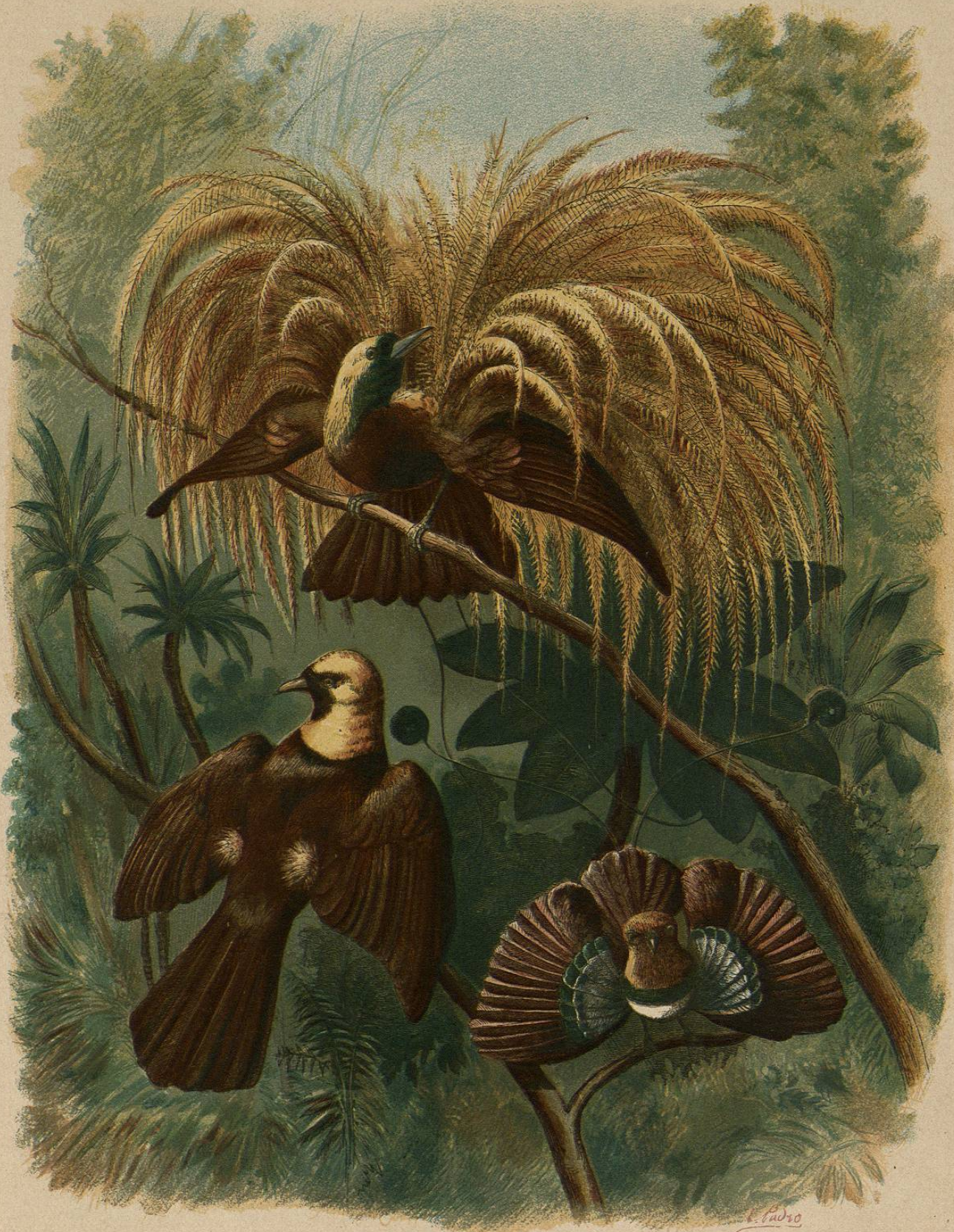
GRUPO DE PARADISIDOS

USOS DOMESTICOS Y REGIMEN. — El pica-bueyes de Africa, llamado aretseh de los ocho individuos, que solo se conocen con los grandes mamíferos; siguen á los rebaños de búfalos y vacas, y se posan en su lomo. Los viajeros que han recorrido el sur de Africa nos dicen que se les ve hasta cerca de los elefantes y rinocerontes; y Le Vaillant asegura tambien que siguen á los antilopes, fijándose sobre todo en los animales heridos, cuyas llagas atraen las moscas. Por esta razon los aborrecen los abisinios, pues creen