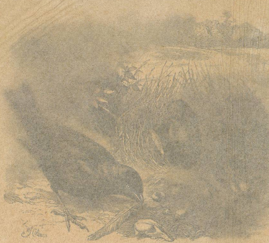
Fig. 19.—EL TILONORINGO SATINADO