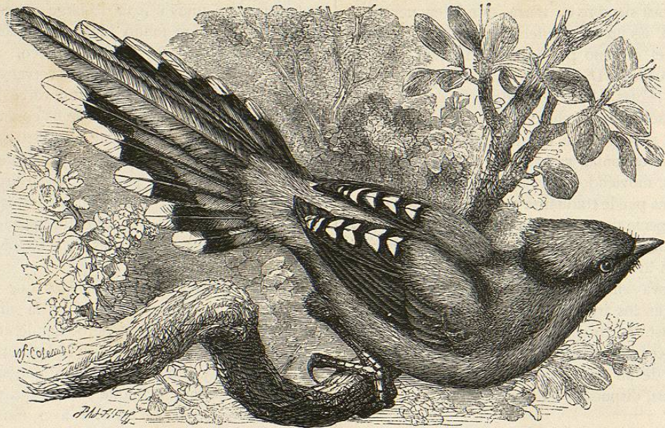
Fig. 45.—EL QUITA DE LA CHINA

CARACTERES. — Esta ave se distingue de sus congéneres mas afines y de todas las aves en general por la diferencia de pico entre macho y hembra. El de aquel es de una longitud igual á la cabeza poco mas ó menos, con la arista superior casi recta, ligeramente redondeado en el sentido de su anchura á la vez que fuertemente comprimido lateralmente, alto en la base y disminuyendo gradualmente