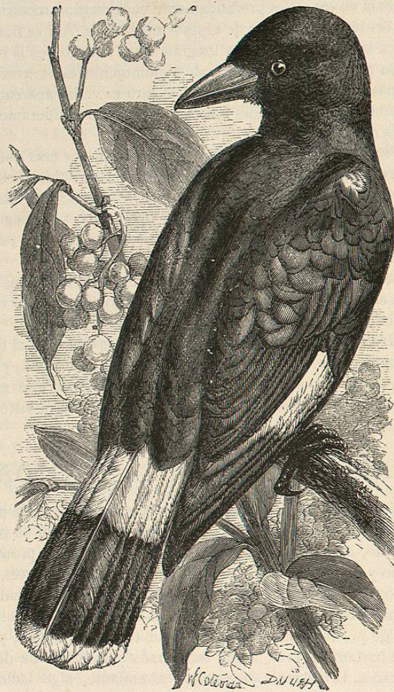
Fig. 47.—EL DESPERTADOR CUERVO

Aunque estas aves cazan principalmente insectos, persiguen también á todas las aves pequeñas, y son tanto más peligrosas, cuanto que no temiendo estas, tienen en ellas una confianza que suele serles fatal. Un lánido permanece varios minutos tranquilo en medio de las avejillas: canta con ellas para inspirarles confianza, y después salta de pronto sobre la más próxima y la mata. Tienen también la singular costumbre de clavar su presa sobre las espinas: donde vive una pareja de estas aves se puede estar seguro de en-