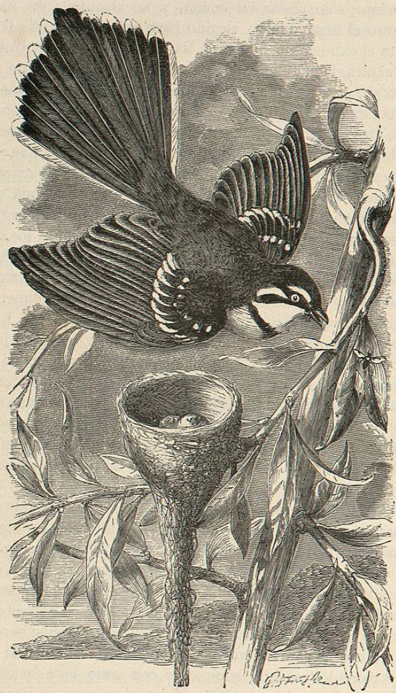
Fig. 64.—EL RIPIDURO NEVATILLA

sobre la reproducción del picotero de Europa. Solo en 1857 Wolley logró encontrar un nido y huevos el 16 de junio, pero un dependiente suyo había hecho ya el mismo descubrimiento el año anterior. Wolley estaba resuelto á no volver á Inglaterra sin un nido, y no economizó trabajo ni dinero para conseguir su fin. Después de encontrados los primeros nidos, todos los habitantes de Laponia, según parece, co-