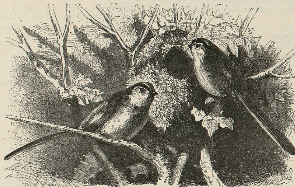
Fig. 74.—EL ORITE DE LARGA COLA

CARACTERES. —Tienen el pico bastante prolongado; pero lo que les caracteriza sobre todo, es el moño que forman las plumas de la parte superior de la cabeza.