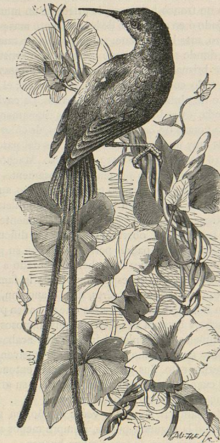
Fig. 87.—EL HEDIDIPNO MALAQUITA

gustando mucho de recorrer de una sola vez largas distancias. Comunmente se lanza desde la copa de un árbol á la