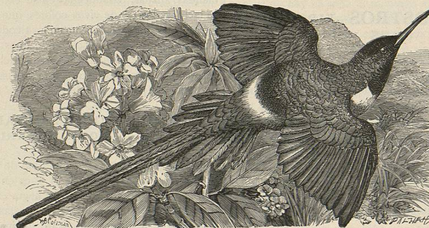
Fig. 88.—EL ETOPIGO MENOR

base del tronco de otro; salta, déjase caer, vuela algun tiempo rasando la tierra; remóntase un poco, y se coge al fin al árbol como antes. Su grito acostumbrado es sí , bajo y bastante parecido al de los paros y de los reyezuelos; el de lla-