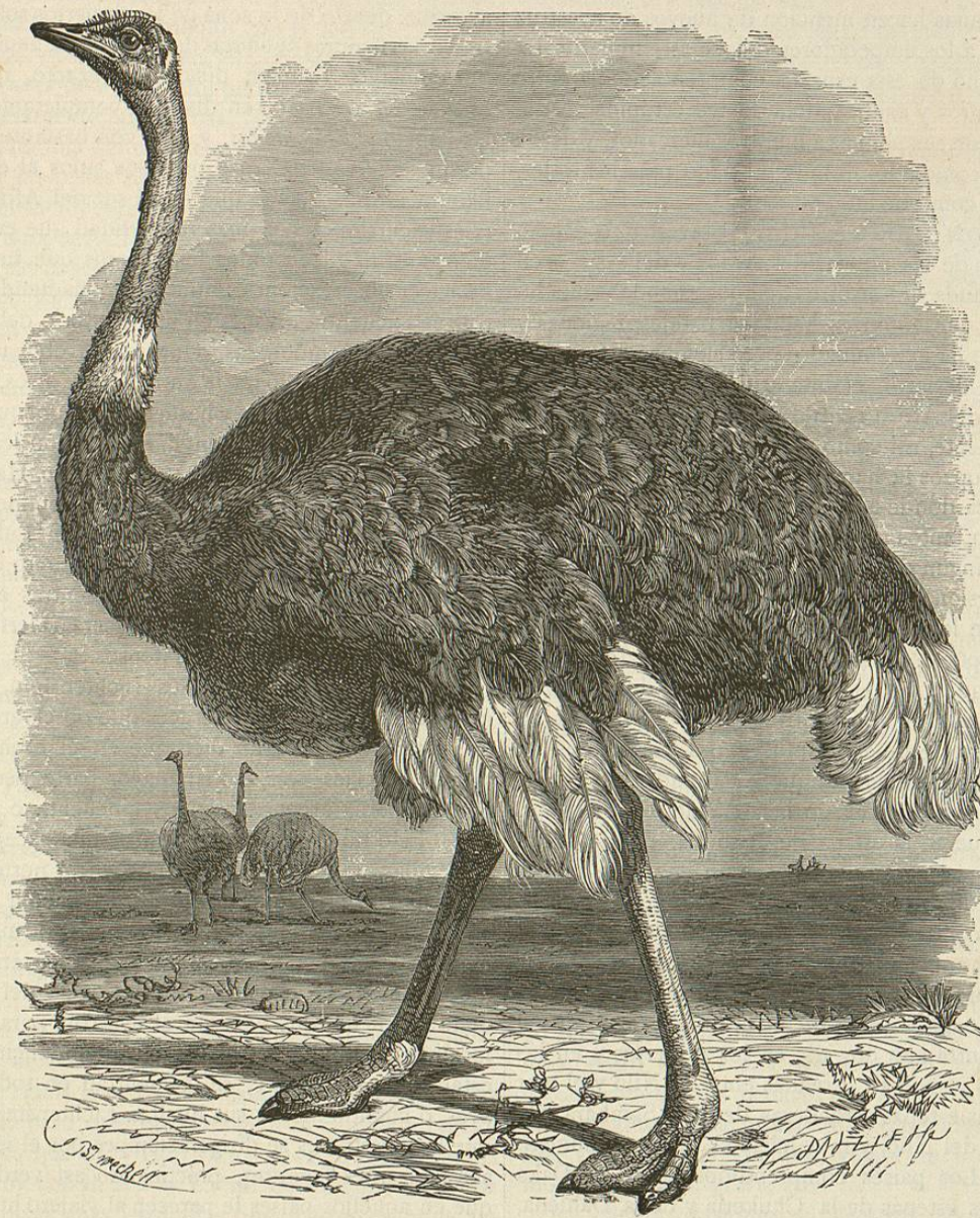
Fig. 154.—EL AVESTRUZ CAMELLO

Por el grabado que se acompaña (fig. 153) se comprenderá mejor que con una larga descripción, cuánta es la fuerza de estas aves, y qué curiosas las modificaciones de su estructura interna.