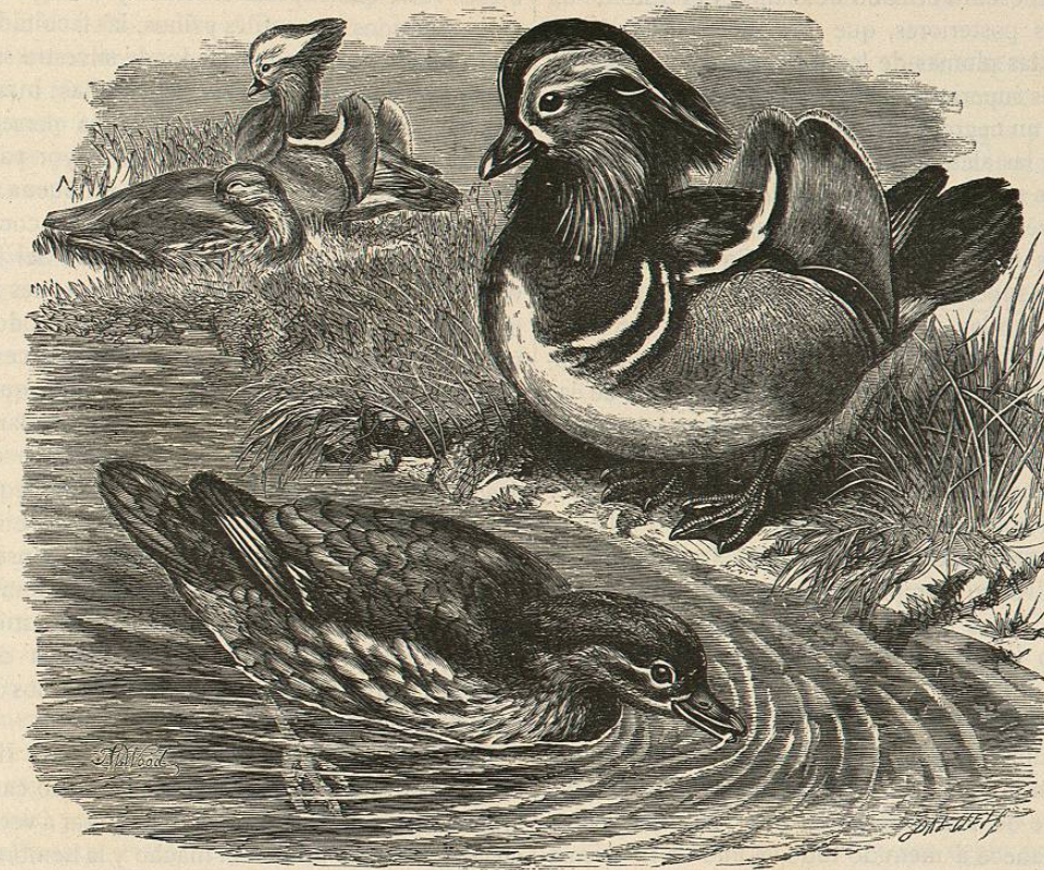
Fig. 223.—EL AIX MANDARIN

USOS Y PRODUCTOS. —La carne es muy sabrosa y