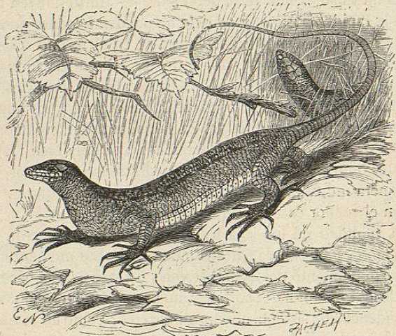
Fig. 24.—EL LAGARTO VIVÍPARO

adecuado, ó calor, y si pronto no se pone correctivo no tarda en morir. La persona que cuida diariamente y con cariño á estos pequeños reptiles, acaba muy pronto por conquistar su confianza. Al principio el lagarto huye tan pronto como se acerca el amo y se esconde en la parte mas recóndita de su prision; despues ya empieza á sacar del agujero la cabeza con curiosidad, y por fin, ya no huye y permite hasta que le toquen y le pasen la mano por el lomo, y no pocos llegan á tomar la comida de las manos de su guardian. Es verdaderamente divertido, cuando se tienen reunidos varios lagartos en una misma jaula, echarles un gran gusano: procuran entonces robarse la presa los unos á los otros; cada cual tira por un lado, hasta que se rompe, ó el mas fuerte acaba por llevársela quitándola de la boca á los demás. Gluckselig asegura que los lagartos llegan á domesticarse hasta el punto de ju-