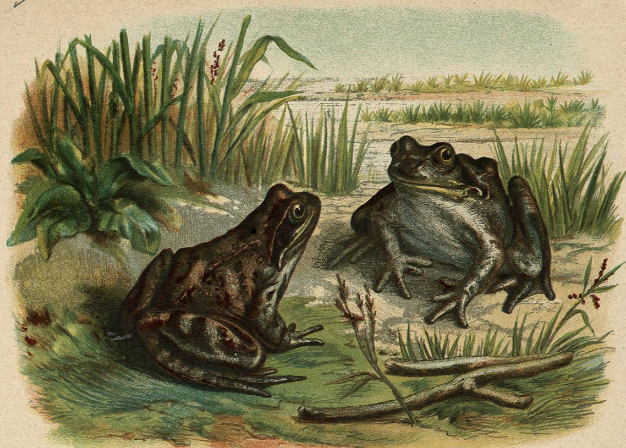
LA RANA TEMPORARIA

Ofrece algunas dudas separar esta especie (fig. 93) de la anterior; mas para ello se pueden tener presente las siguientes razones: el hocico es siempre más obtuso ó redondeado; el tímpano más pequeño; se tiene del todo en diámetro la anchura del párpado superior; los dos grupos que forman los dientes vomerianos son más angostos; las protuberancias glandulosas que bordean el lomo en cada lado, mas anchas; y por último, la coloración es diferente, y distinto el olor que exhala la rana