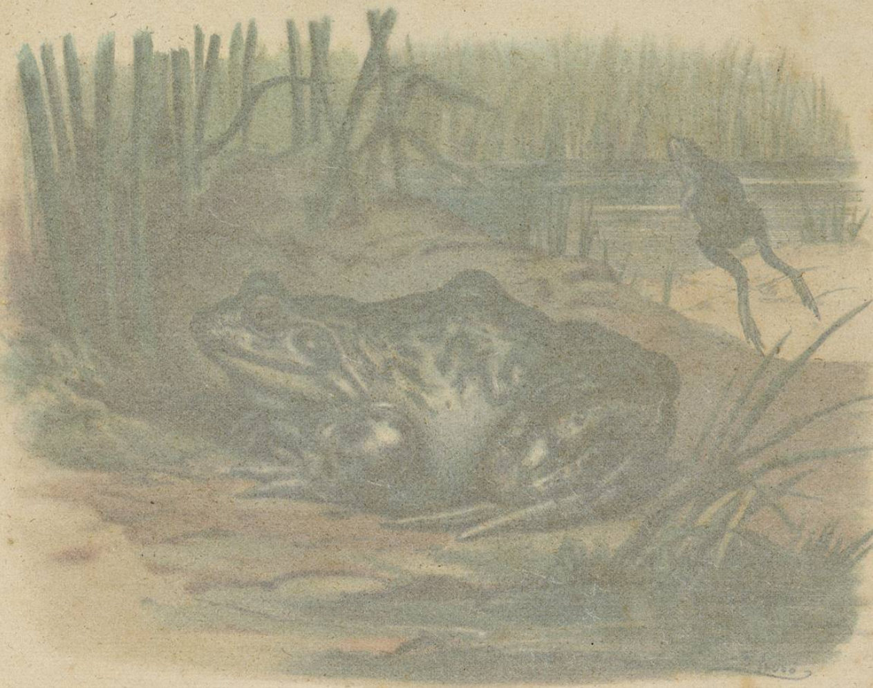
LA RANA MUCIDORA