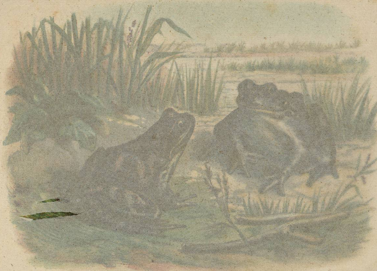
LA RANA TEMPORARIA

CARACTÉRES. —Ofrece algunas dudas separar esta especie (fig. 93) de la anterior; mas para ello se pueden tener en cuenta las siguientes razones: el hocico es siempre mas corto, mas obtuso ó redondeado; el tímpano mas pequeño, no tiene del todo en diámetro la anchura del párpado superior; los dos grupos que forman los dientes vomerianos son mas angostos; las protuberancias glandulosas que bordean el lomo en cada lado, mas anchas; y por último, la coloración es diferente, y distinto el olor que exhala la rana