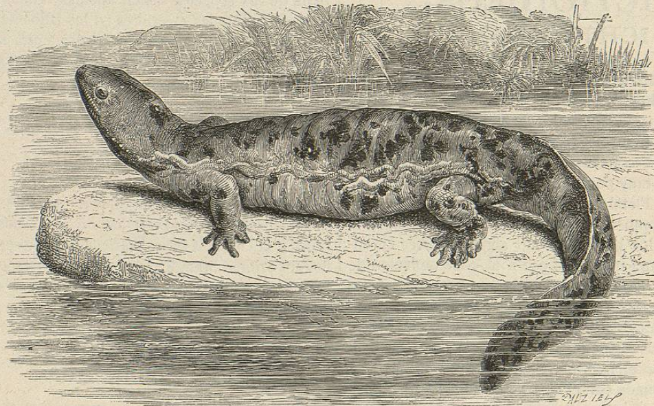
Fig. 110.—EL CRIPTOBRANCO HÓRRIDO

DISTRIBUCION GEOGRÁFICA. —Siebold descubrió al mas grande de todos los batracios vivos, en el segundo de-