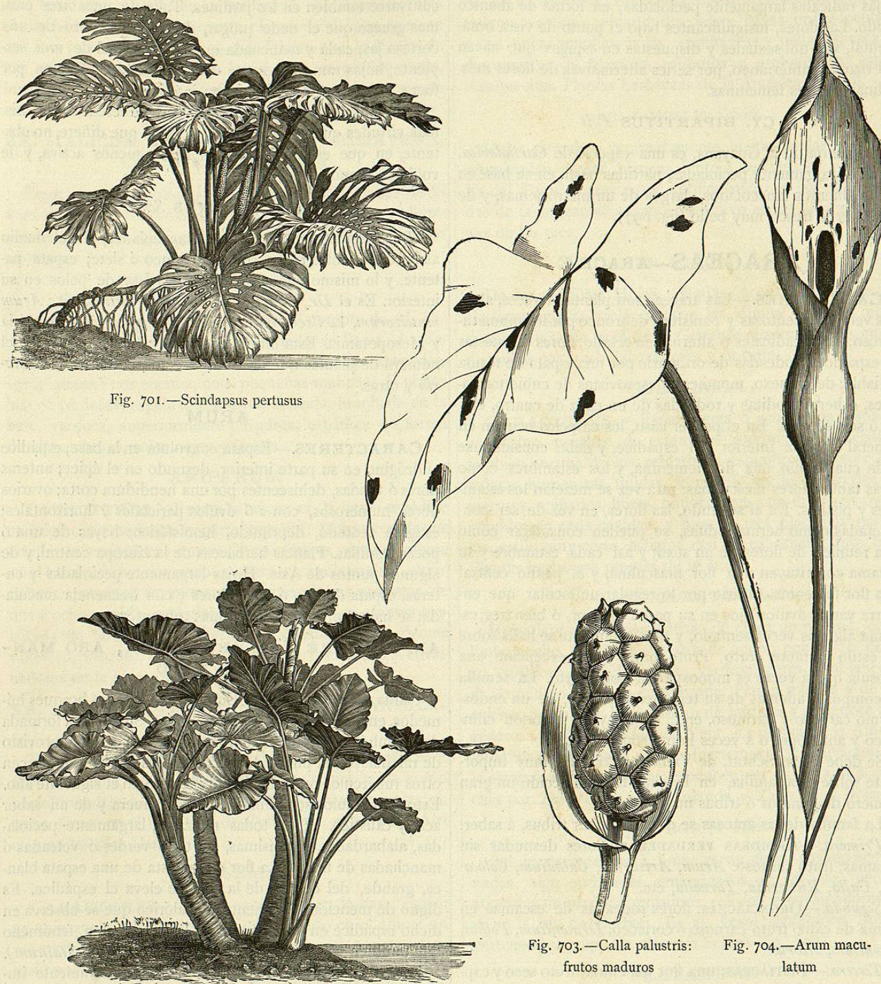
Fig. 701.— Scindapsus pertusus

persistente; ovario ínfero, unilocular, con cuatro placentas parietales y numerosos óvulos horizontales; estigma sentado y cruciforme; fruto baya tetrágona y unilocular. Las especies de este grupo son plantas casi siempre caulescentes, de tallos frecuentemente trepadores, y provistos de radículas aéreas con las cuales se adhieren á la corteza de otros árboles de