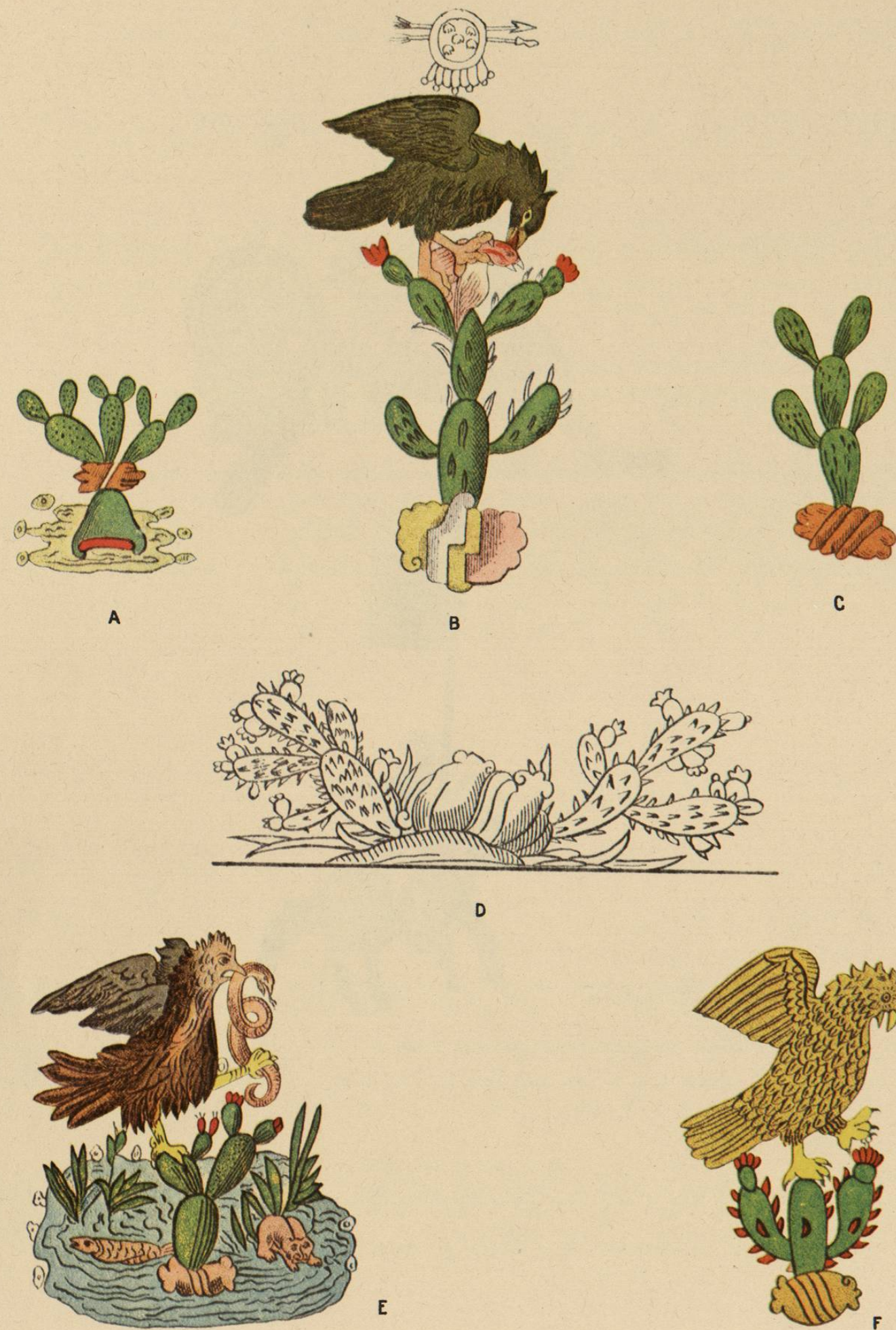
Escudos de armas de México y nombre jeroglífico de Tenochtitlán.— A y C, jeroglíficos de Tenochtitlán; B, Atepetlahuiztli, Armas de México. Fundación de Tenochtitlán, asiento de Huitzilopochtli; sobre el Águila flechas y el escudo de la deidad llamado IHUITEYO CHIMALLI; D, Nombre de Tenochtitlán según un grabado de 1556, de las Constituciones del Arzobispado de México; E, Lugar del tunal del águila en donde se fundó la ciudad según la tradición; F, Armas y nombre de Tenochtitlán del Códice de Mendoza.