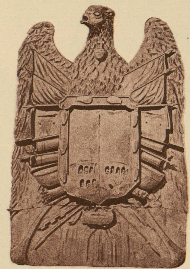
Escudo de armas de la Ciudad de México, concedido por el Emperador Carlos V, según la cédula de 4 de Julio de 1523. Fuente Monumental del Salto del Agua.