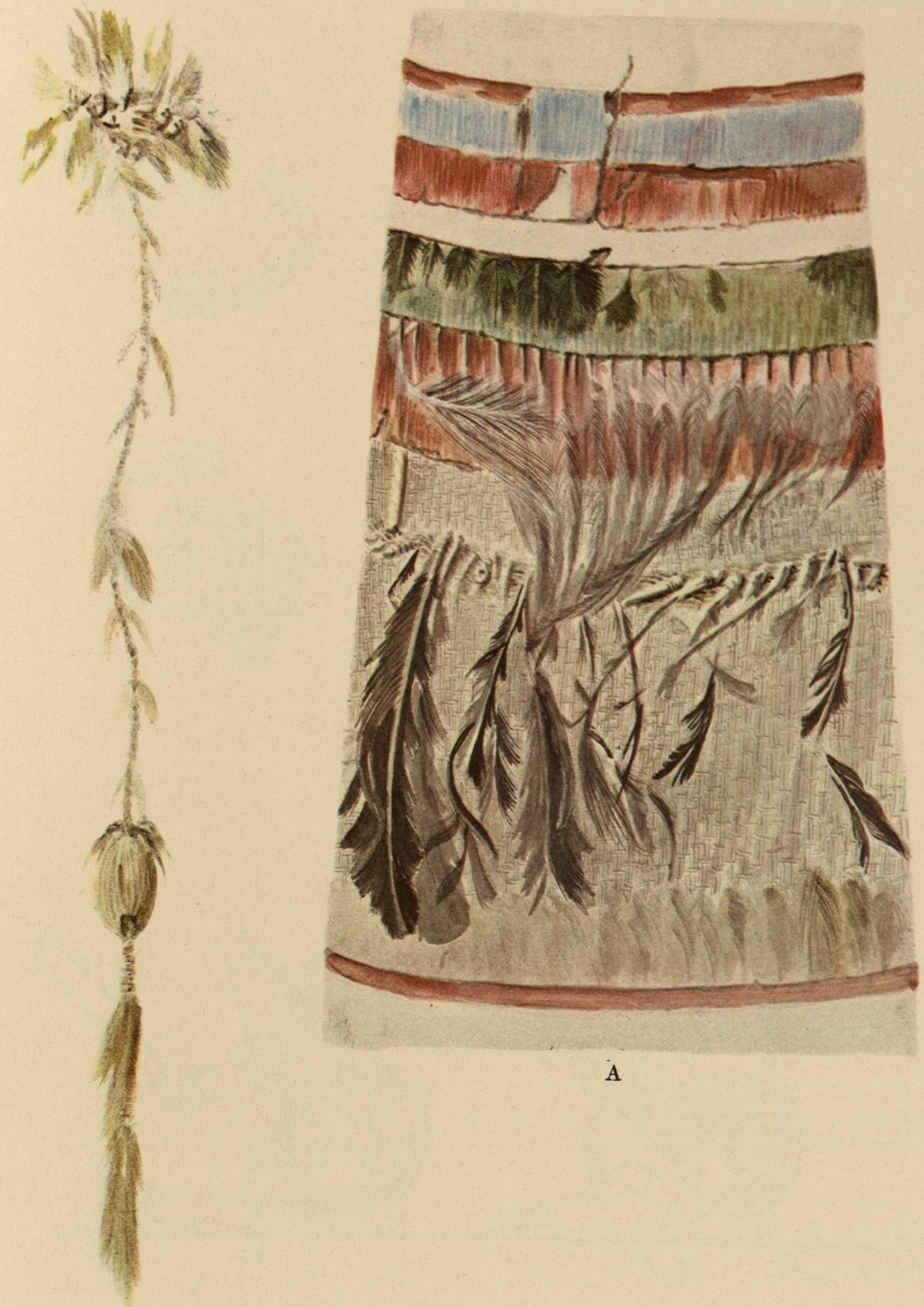
DETALLES DE UNA PARTE DE LA RODELA DE MOCTEZUMA.

A, del mosaico de plumas; B, de las borlas colgantes. La rodela está formada en un armazón de varitas que tienen de tres á cuatro milímetros de diámetro.