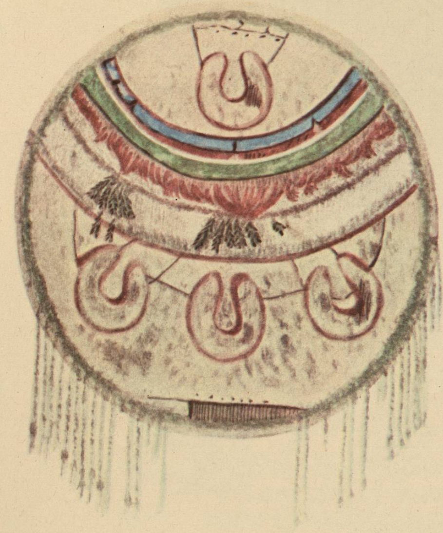
RODELA DE MOCTEZUMA.

Conservada en el Museo Nacional de México: está hecha de mosaico de pluma y de piel de tigre, le faltan las medias lunas de oro, pertenece á la clase Quetzal cuexyo chimalli, y tiene de diámetro sesenta y siete centímetros y medio.