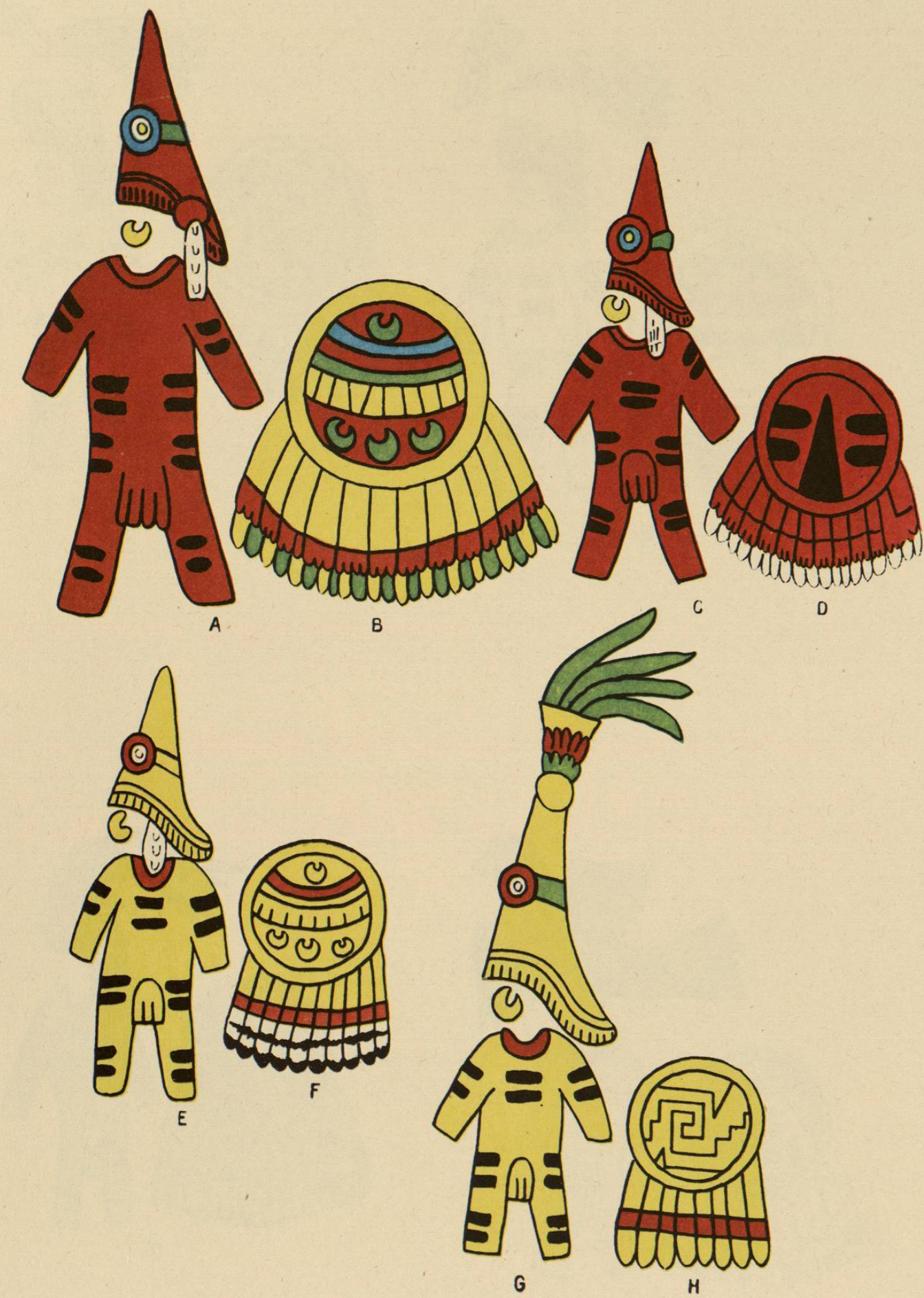
Trajes militares y divises de los guerreros mexicanos.—A, C, Trajes cuextecatí de color rojo, TLAPALCUEXTECATI; E, G, traje cuextecatí, coticcuetecatí, de color amarillo, B, escudo quetzalcuexyochimalli, D, escudo cuextecatí, tipo, y adecuado al vestido; F, escudo cuexyochimalli; H, xicalcoluhquichimalli.