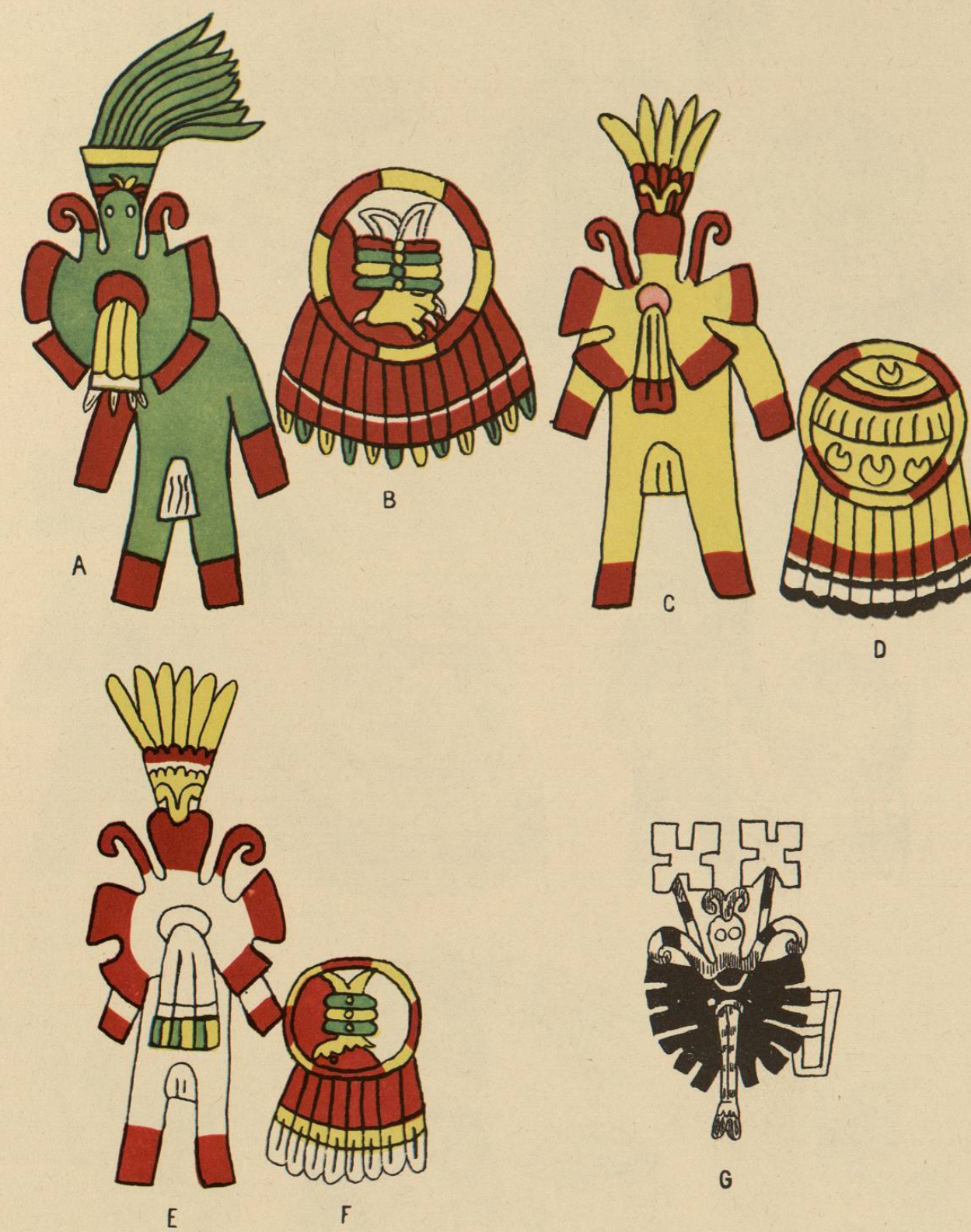
Trajes militares y divisas de los guerreros mexicanos. — A, Vestido papalotl, verde, y divisa QUETZALPAPALOTL; B, escudo CUAUHTETEPONYOCHIMALLI; C, vestido PAPALOTL, amarillo, de oro, divisa ZACUANPAPALOTL, de plumas amarillas del pájaro ZACUAN; y D, escudo, CUEXOCHIMALLI; E, vestido PAPALOTL, blanco y rojo; F, escudo CUAUHTETEPONYOCHIMALLI; G, bandera, ITZPAPALOTL, de color negro, hecha de plumas negras de cuervo ó de láminas de cobre.