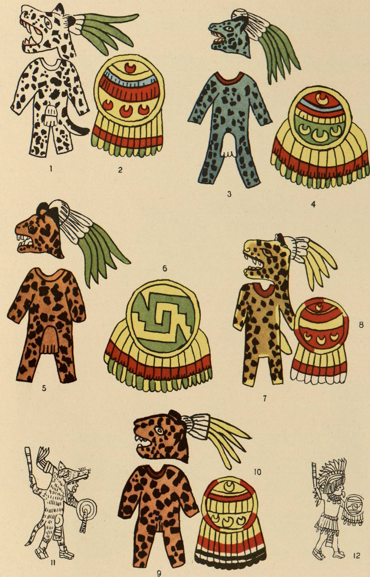
Trajes de guerreros mexicanos.—Vestido ocelotl, figs. — 1, Vestido ocelotl, de color blanco; 3 azul; 5 y 9, rojos; 7, amarillo; 2, 4, 8 y 10, escudos, cuxyo chimalli; 6, escudo quetzalcuolihouichimalli; 11, Tozoyotl, de color amarillo, en el original, con escudo de Xipe, del manuscrito azteca de Sahagun, segun el Doctor Selier de Berlin; 12, guerrero Tlatoani llevando la bandera QUETZACPATZTLI, de color verde, vestido azul, y el escudo QUETZALXICALCOLIHOUICHIMALLI, del manuscrito azteca del P. Sahagun, segun el Doctor Selier de Berlin.