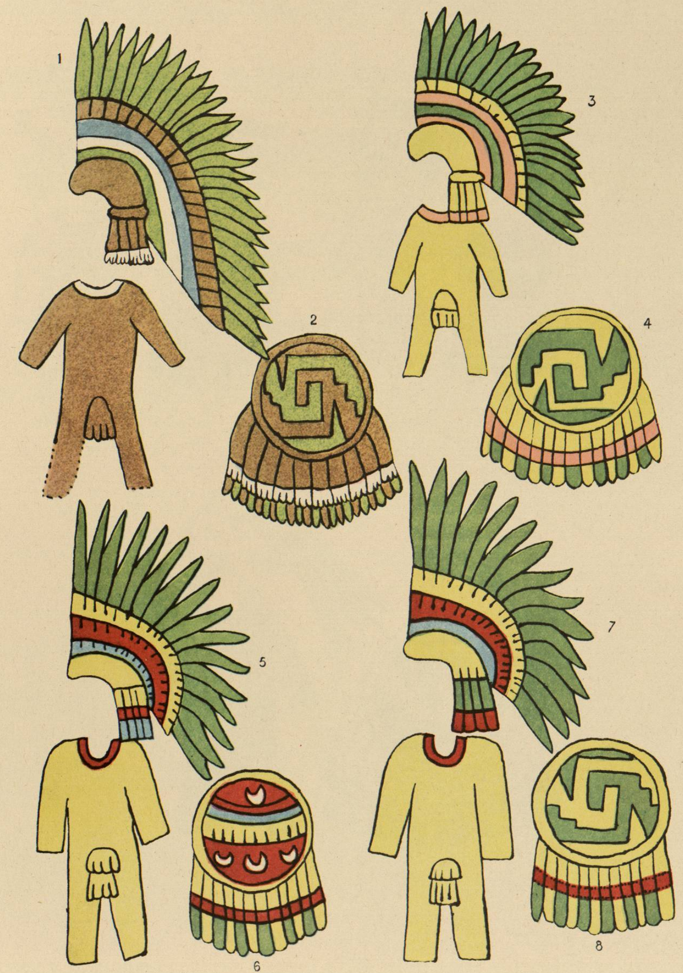
Trajes guerreros y divisas de grandes capitanes.—1, 3, 5, 7, Bandera fija á las espaldas, Quetzalpatzactli; 2, 4, 8, escudo nacional, Quetzalcalcolliuhquichimalli; 6, Cuexyochimalli, de color rojo.