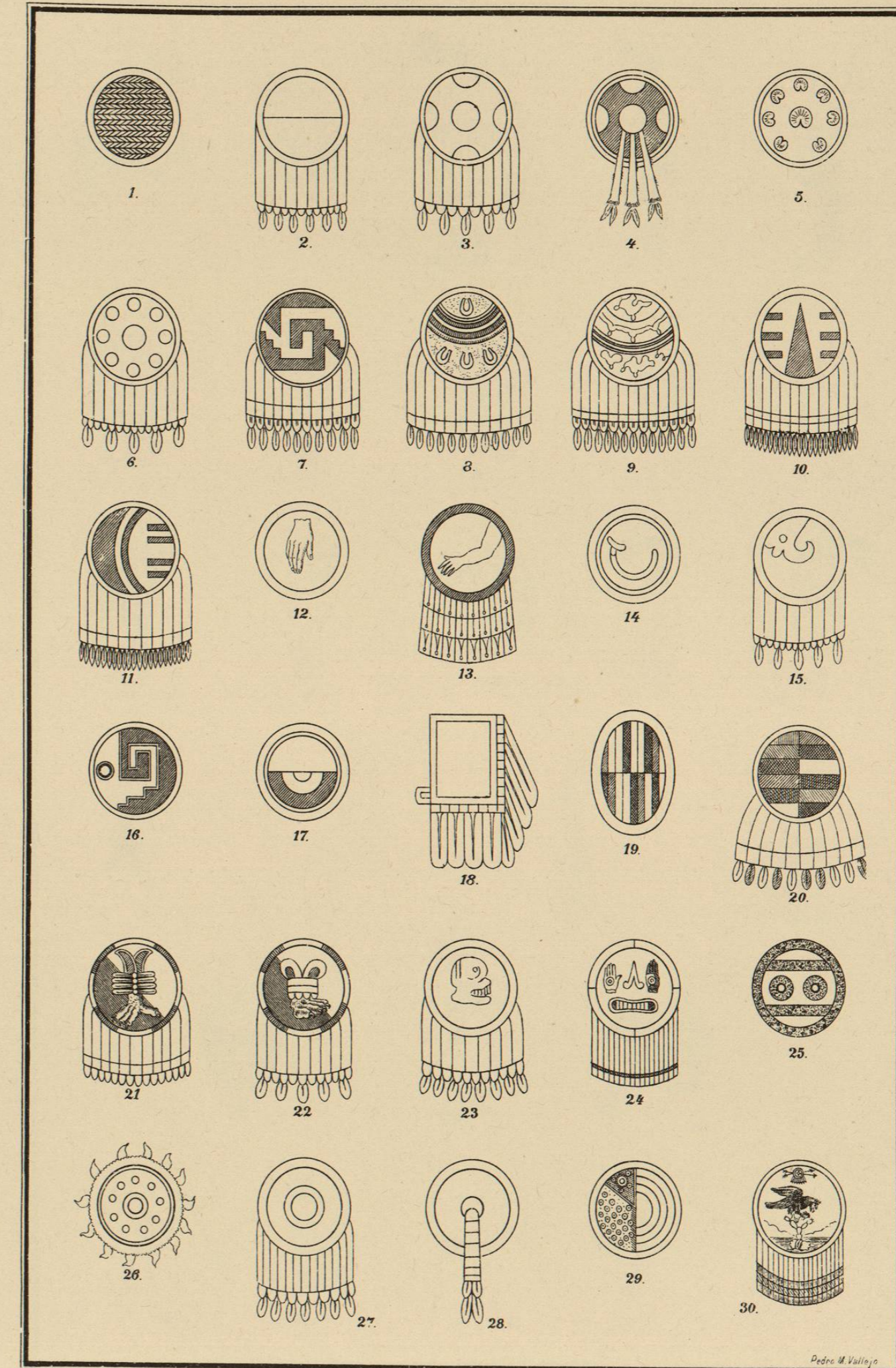
CUADRO COMPARATIVO DE LOS ANTIGUOS ESCUDOS MEXICANOS.

1. Escudo de varas de otatl.—2. Quetzalpoztequi chimalli.—3. Teocnitateteyochimalli.—4. La misma forma.—5. Ihuiteteyochimalli de Huiztlopochtli.—6. Citlalochimalli.—7. Quetzalxicalcoluhquichimalli.—8. Quetzalcoeyochimalli.—9, 10, 11. Cuextecachimalli.—12. Macpallochimalli.—13. La misma forma de Huiztlo.—14. Tetzacamecillochimalli.—15. Icoluhquichimalli.—16. La misma forma de Von Hochstetter.—17. La forma anterior de un barro de Texcoco.—18. Escudo rectangular de Xochicalco.—19. Escudo ovalar chichimeca.—20. Escudo chichimeca del Códice de Mendoza.—21. Uauhueteponyochimalli.—22. Oceloteponyochimalli.—23. Tozmiqizyochimalli.—24, 25. Texaxcallochimalli, del Lienzo de Tlaxcala.—26. Ihuitzeuquichimalli.—27. Escudo Anahuayo del jefe del ejército.—28. Variedad del anahuayochimalli de Xipe.—29. Escudo del rey Axayacatl, monumento de Cuernavaca.—30. Escudo de armas de México.