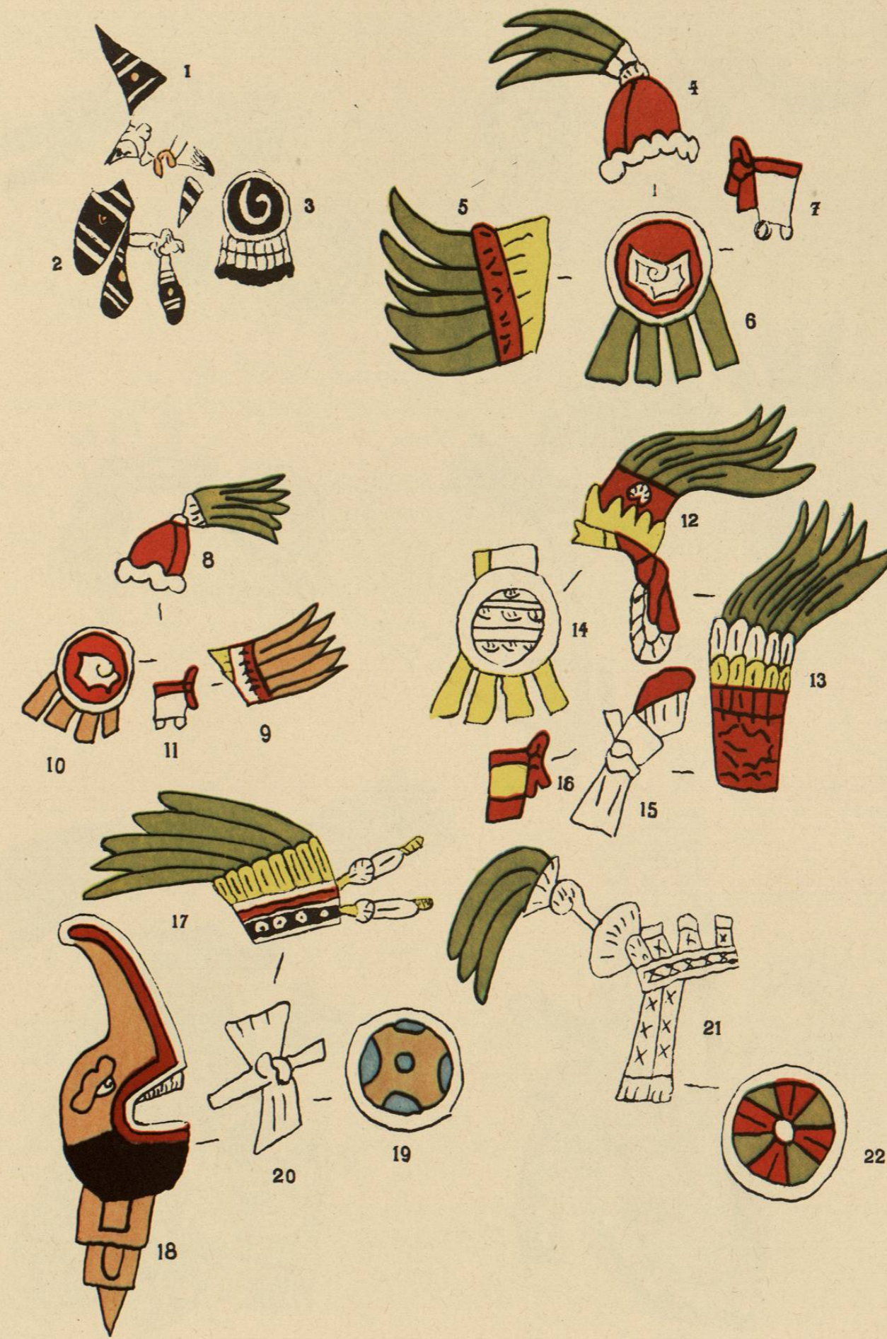
Distintivos mitológicos.—1, 2, 3, Atavíos del Quetzalcoatl del historiador Fr. Diego Durán.—4, Copilli sacerdotal.—5, Manta figurando alas de mariposa.—6, Escudo de la deidad.—7, Tecucocxtili ó jarreteras que cubrían la pierna hasta la garganta del pie, anudándose por fuera.—8 ó 11, Los mismos atavíos en otra figura de la misma deidad y en el mismo manuscrito.—12 ó 16, Tezcatlipuca del M. S. Sahagún de Florencia.—13, Casco para la cabeza.—14, Tlahuiztli, principio del Quetzalpatzactli.—15, Escudo quetzalcoexochimalli.—16, Machoncoti para el brazo izquierdo.—17 ó 20, Distintivos del Dios Xiuhcoatl, del M. S. ya mencionado de Sahagún.—17, Corona, tlacochtzontli.—18, Divisa de la deidad, llamada Xiuhcoatl, serpiente de fuego.—19, Teocuitlateteyochimalli.—20, Brazaete ó machoncoti del brazo derecho.—21, 22, Corona y escudo del Dios Napatcucuhli, del M. S. Sahagún de Florencia.