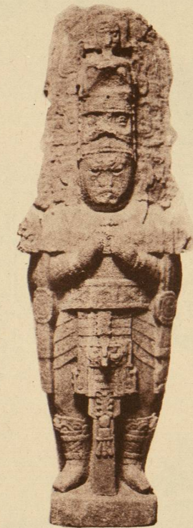
ESTATUA DEL DIOS DEL FUEGO.

Procedente del Estado de Tabasco.—Colección del Museo Nacional.