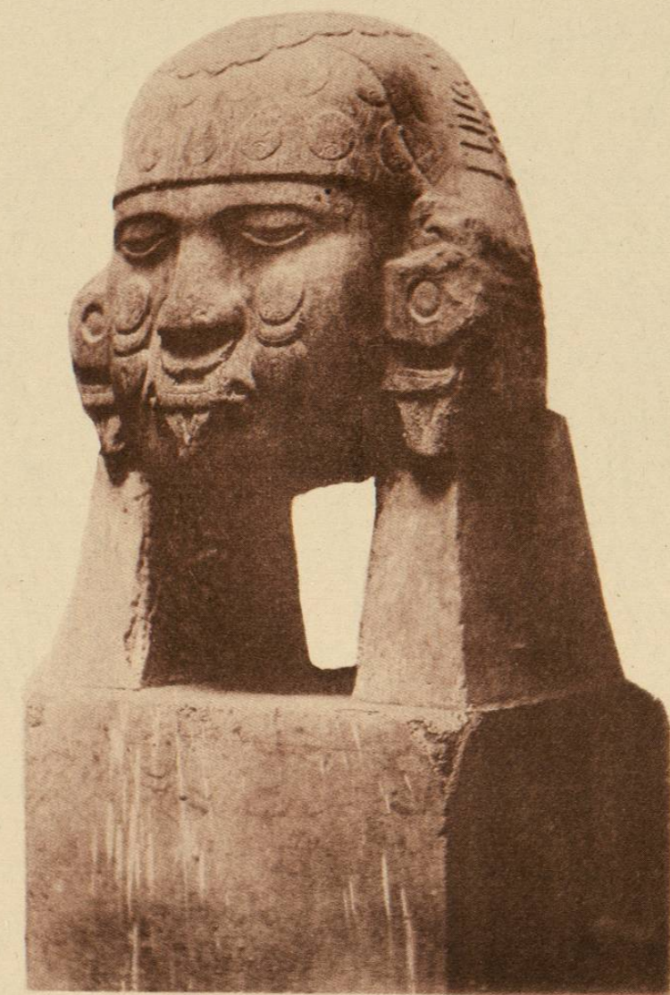
TOCADO DE LA CABEZA DE DIORITA, EXISTENTE EN EL MUSEO NACIONAL.