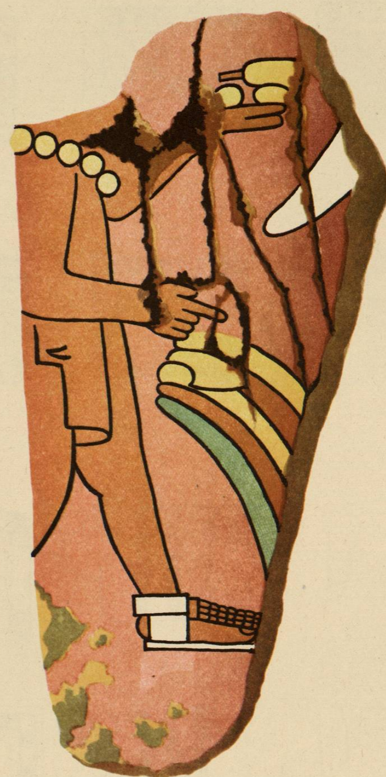
Fragmento de un fresco de Teotihuacán. Forma de cactli. Dibujo del distinguido pintor Domingo Carral.