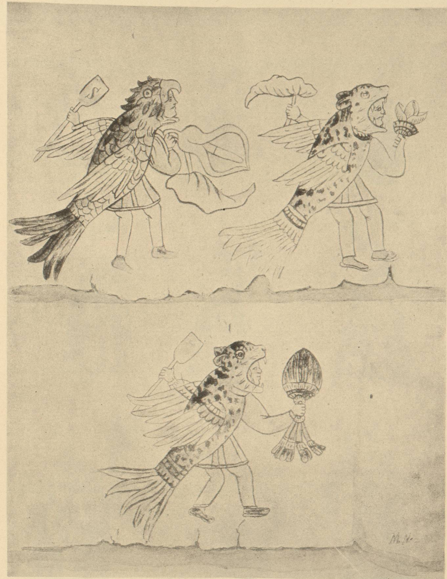
DANZANTES CUAUHTLI Y OCELOCUAHTLI QUE RECIBIERON AL VIREY,

Según el manuscrito original de Xochipilla, existente en el Museo Nacional, bajo el número 16.