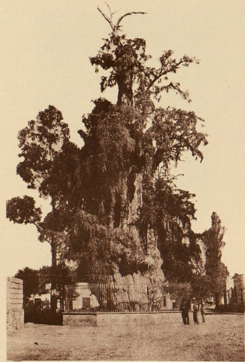
EL ARBOL DE LA NOCHE TRISTE EN POPOTLA.

Lugar histórico de la retirada de Cortés.