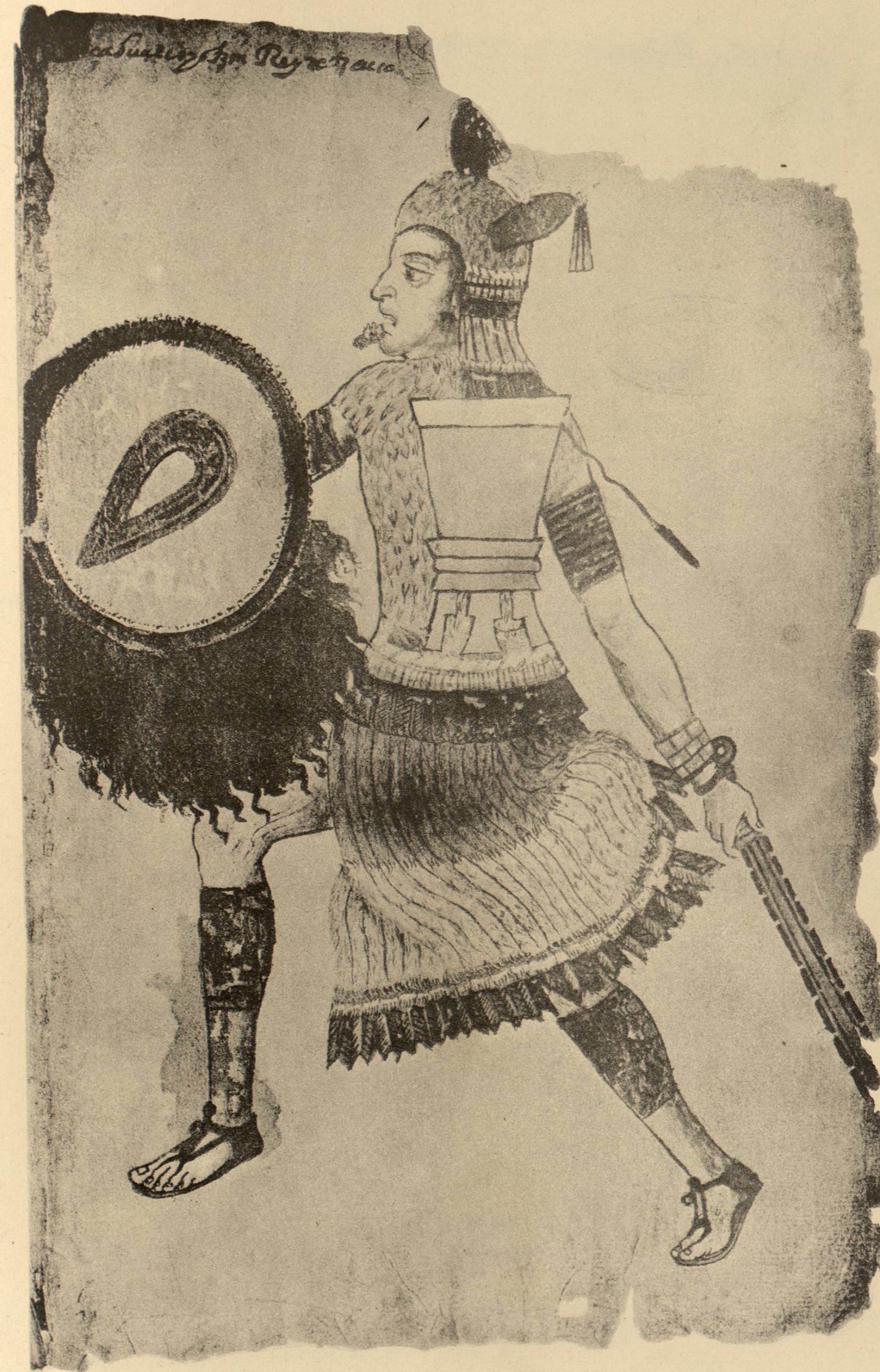
RETRATO DE NEZAHUALCOYOTL, REY DE TEXCOCO.