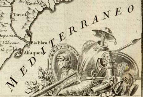
MAPA DE UNA PORCIÓN DEL REYNO DE ESPAÑA QUE COMPREHÉNDE LOS PARÁGES POR DONDE ANDUVO DON QUIXOTE, Y LOS SITIOS DE SUS AVENTURAS. Delinido por D. Tomás López Geógrafo de S. M. según las observaciones hechas sobre el terreno por D. Joseph de Hornosilla Capitán de Ingenieros.