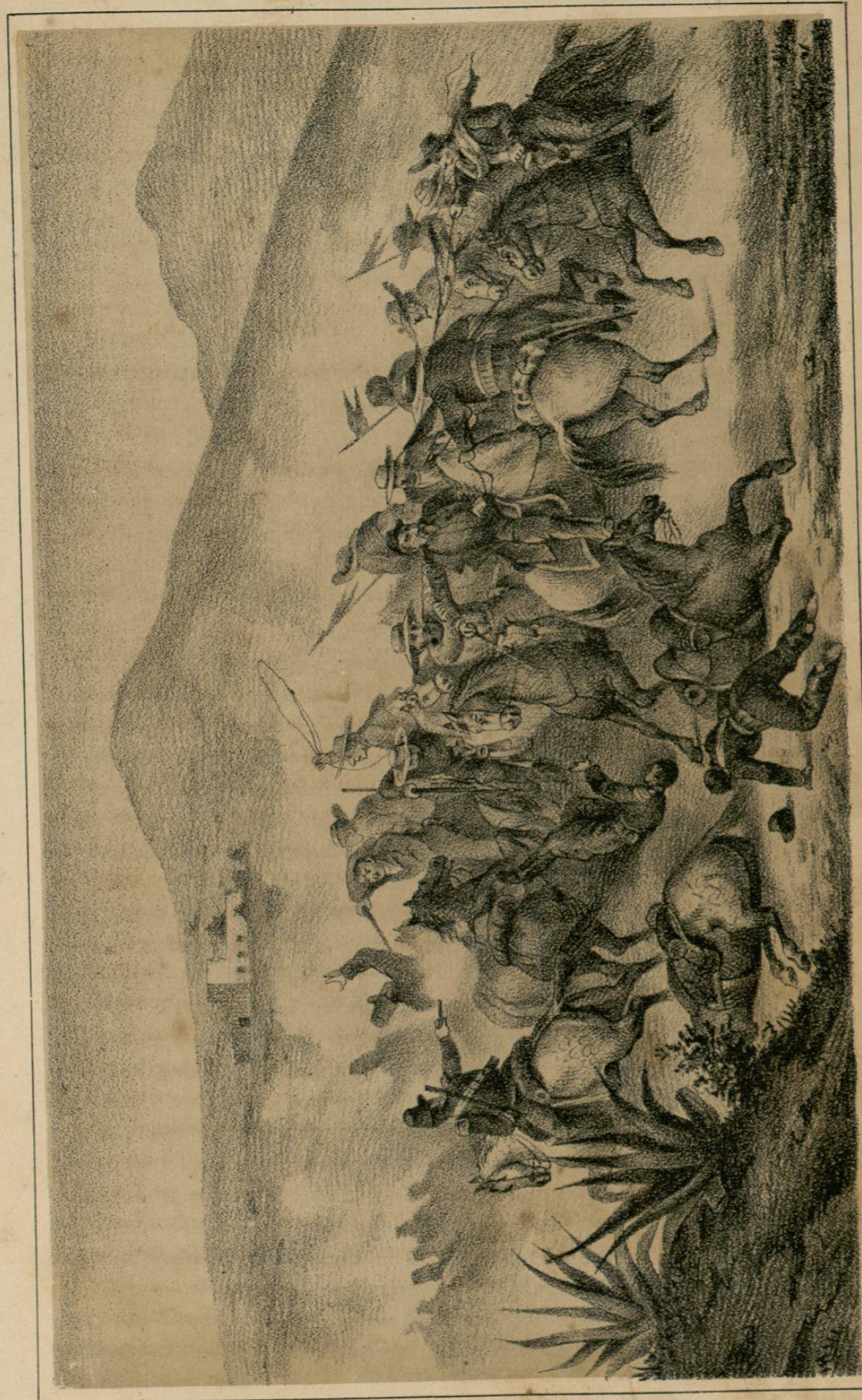
Los exploradores mexicanos hacen prisionero á un jefe francés en las inmediaciones de Orizaba.