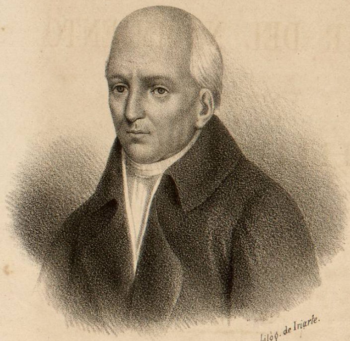
Litog. de Iriarte.