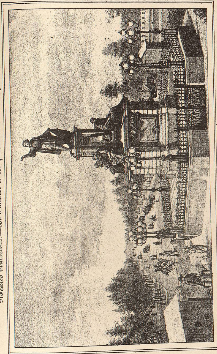
Monumento de Colon, en el Paseo de la Reforma.

México Pintoresco.—De Plateros á los paseos de Buenavista y la Reforma