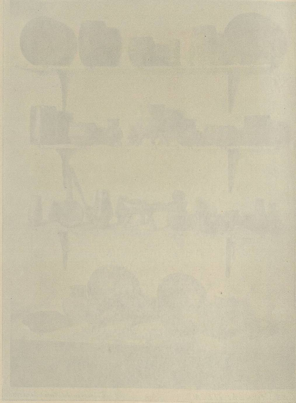
LA CIVILIZACIÓN ZAPOTECA.