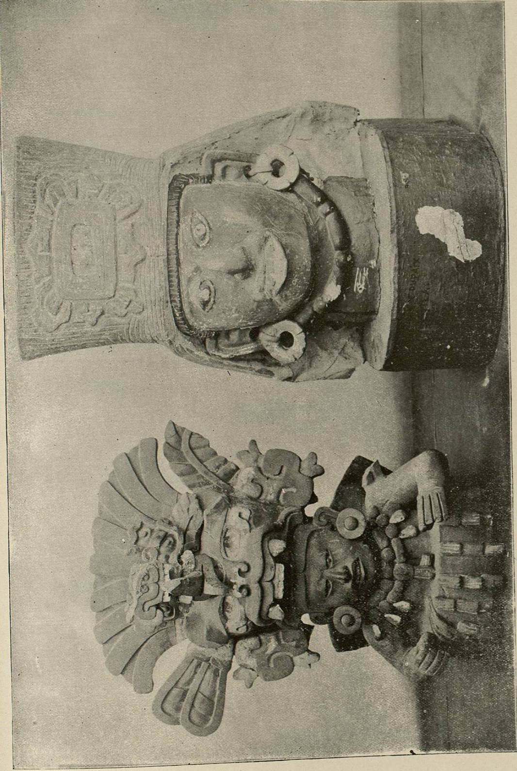
Objetos de barro de las colecciones mixteco-zapotecas del Museo N. de México. (Expedición Dupaix.)