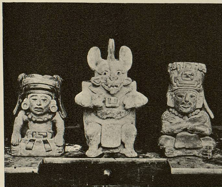
Fig. 1. a