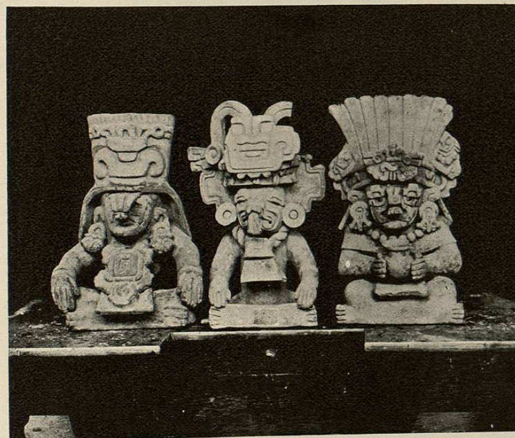
Fig. 2. a