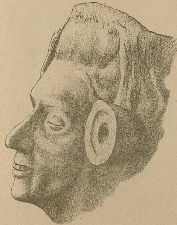
Cabeza de una figura de barro de la colección Mizteco-Zapoteca del MUSEO N. DE MEXICO.