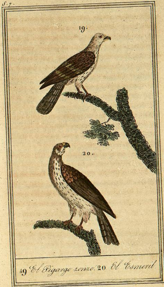
19 El Pigargo zonzo . 20 El Esmeril .

El macho del pigargo zonzo es, como entre las demas aves de rapiña, considerablemente mas pequeño que la hembra; pero se nota fácilmente comparándolos, que carece de collar, ó no tiene como ella el cuello rodeado de pequeñas plumas erizadas. Esta diferencia, que parece ser un carácter específico, me inclinaba á creer que el ave representada en el núm.º 480 no era el macho de la hembra pigargo representada en el núm.º 443: pero halconeros muy hábiles me dieron el hecho por muy cierto; y efectivamente, mirándolo mas de cerca, convencime de que se hallaban en él las mismas proporciones entre la cola y las alas, la misma distribucion en los colores, igual la forma del cuello, de la cabeza, del pico, etc.; de manera, que no pude menos de suscribir á su dictámen. Y no contribuía poco á mis dudas acerca del par-