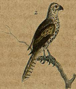
1. Gerifalco blanco. 2. Alcótano.