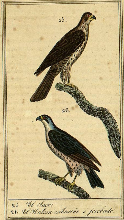
25 El Sacre. 26 El Halcon saharenó o jorobado.

(*) Esta ave no parece diferente del gerifalte. (A. R.)