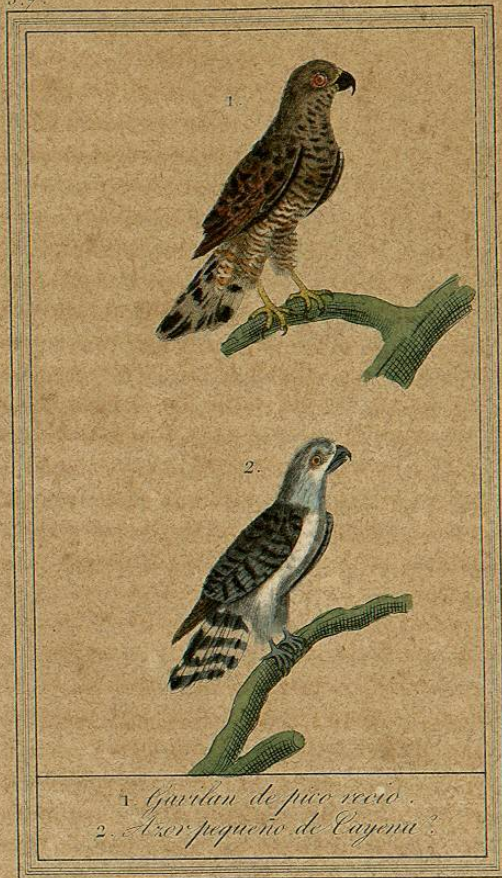
1. Gavilan de pico recio. 2. Azor pequeño de Cayena?

El ave de la Carolina mencionada por Catesby con el nombre de gavilan de los palomos ( Falco columbarius . Gmel.), cuyo cuerpo es mas delgado que el del gavilan comun; el iris amarillo, como tambien la piel que cubre la base del pico; los piés del mismo color; el pico blan-