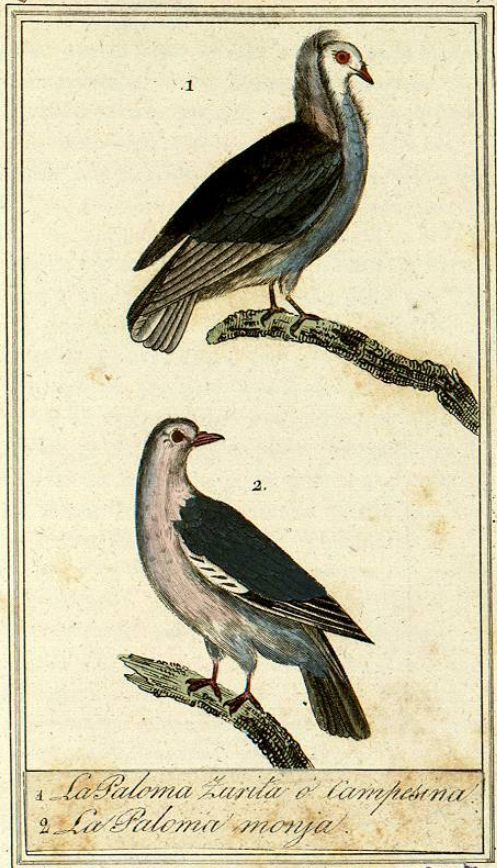
1 La Paloma Zurita ó Campesina

bosques la paloma torcaz, la zurita y la tórtola; mas, privadas de su libertad y de sus hembras, no sería raro que lo verificasen; y como estas tres especies están muy inmediatas, los individuos que nacieren de su unión debieran ser fecundos, y producir por consiguiente razas ó variedades constantes. Sus hijos no serian mestizos estériles, como los de la union de la burra con el caballo, sino todo lo contrario, como los que producen el macho cabrío con la oveja. Si juzgamos el género columbáceo segun todas sus analogías, parece que hay en estado de naturaleza, como ya lo hemos dicho, tres especies principales, y otras dos que pueden considerarse como intermedias. Dieron los Griegos á estas cinco especies nombres diferentes, lo cual solo lo harian estando en la inteligencia de que realmente habia diversidad de especies. La primera y la mayor es la εάττα ó εάσσα , que es nuestra zurita; la segunda πελειάς , que es nuestra torcaz; la tercera la τρογών , ó la tórtola; la cuarta y primera de las intermedias es la οινάς , que por su tamaño algo mayor que el de la torcaz debe ser mirada como una variedad cuyo origen puede atribuirse á nuestras palomas escapadas del encierro. Finalmente, constituye la quinta la εάψ , que es una campesina mas pe-