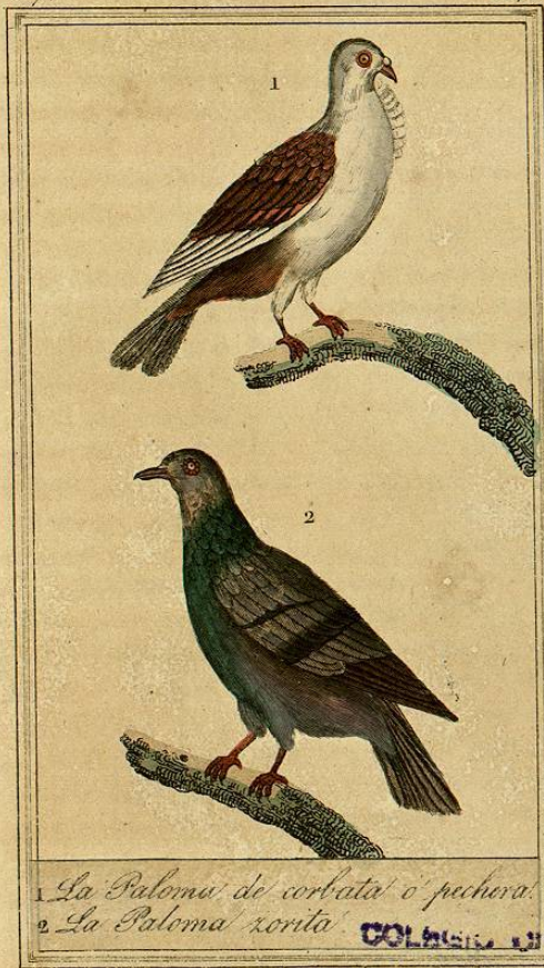
1. La Paloma de corbata o pectoral.

Esto prueba que pueden criarse zuritas domésticas como se crían las demas palomas y las tórtolas, y que en consecuencia quizás han dado origen á las variedades mas hermosas y razas mas grandes de nuestras palomas mansas. Mr. Leroy, teniente de montes é inspector del parque de Versailles, asegura que los pichones zuritos cogidos en el nido se familiarizan y engordan mucho, y que aun las zuritas viejas cogidas en la red se acostumbran con bastante facilidad á vivir en las pajareras, en donde solándolas se las ceba en muy poco tiempo.