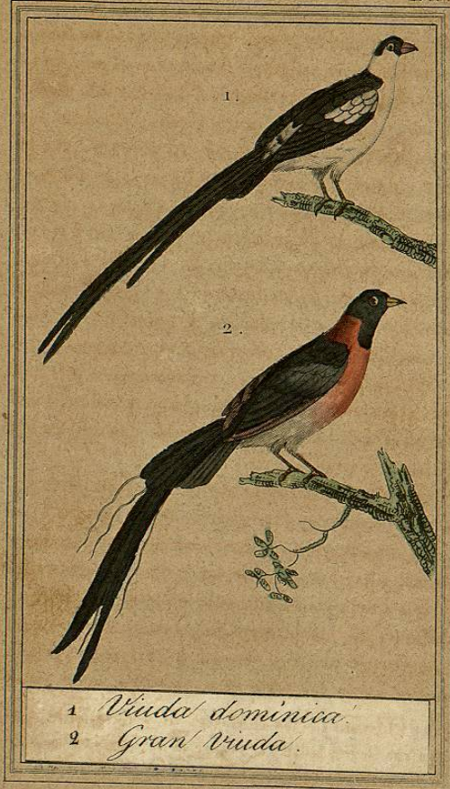
1. Viuda dominica. 2. Gran Viuda.