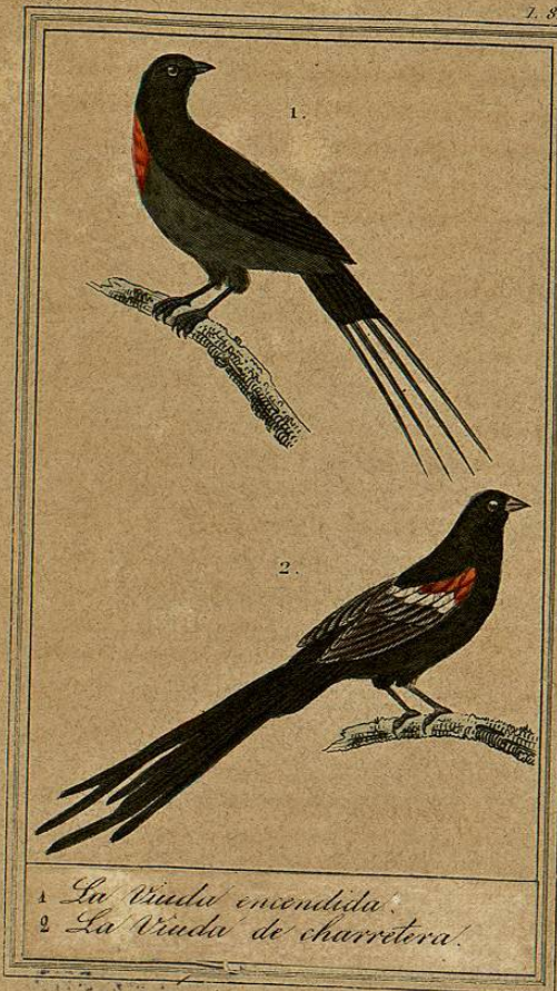
1. La Viuda enmendada. 2. La Viuda de charretera.