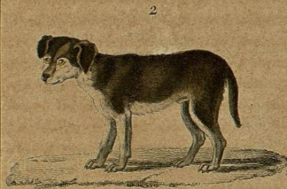
1. Perro mestizo hembra, 1. a generacion. 2. Perro mestizo macho, 2. a generacion.