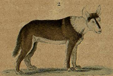
1. Perro mestizo hembra, 2. a generacion. 2. Perro mestizo hembra, 3. a generacion.