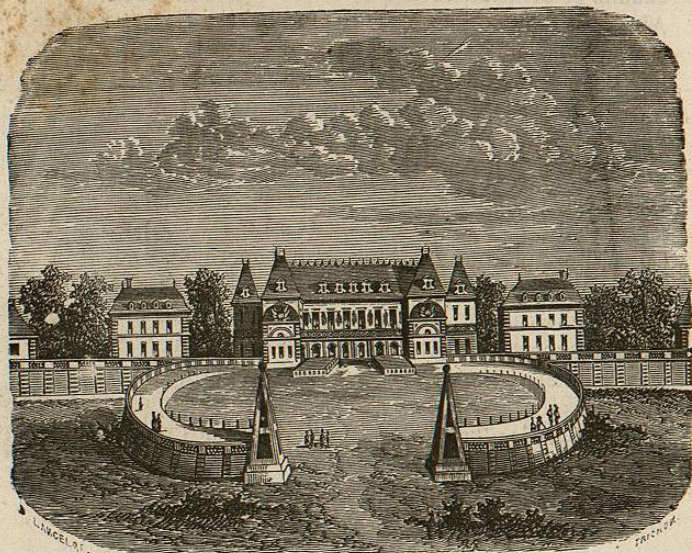
Versalles en tiempo de Luis XIII (entrada principal).

El terrible ministro tenia con la aficion al mando, una notable inclinacion á las letras y las artes, y muchos establecimientos útiles le deben su nacimiento. Richelieu