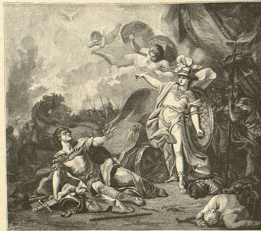
Combate entre Minerva y Marte. (Cuadro de David que obtuvo el segundo premio en R. ma, en 1771, existente en el Museo del Louvre.)