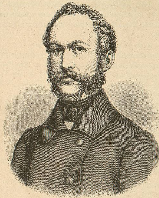
Maximiliano II, rey de Baviera

18 de mayo. — Napoleón III y el rey de Baviera subieron á un pequeño coche que el mismo emperador guiaba y dieron un paseo por las cercanías. El